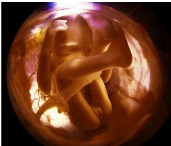
Foster i 18. uge

Et par mere relevante spørgsmål er: Hvornår bliver en menneskelig form en menneskelig skabning? Hvornår er et foster ikke længere en fortsættelse af moderens legeme og sjæl og former sin egen uafhængige identitet? Det esoteriske svar på begge spørgsmål er: Fremskyndelse!