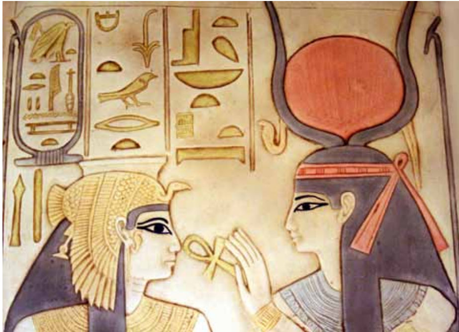
Verdensmoderen Isis (th.) rækker livet (ankh-korset) til dronningen

Ifølge disse informationer er der ingen tvivl om Store Bjørns og Plejadernes vigtighed, og derfor er deres dominerende placering i de gamle kulturer er velbegrunderet.