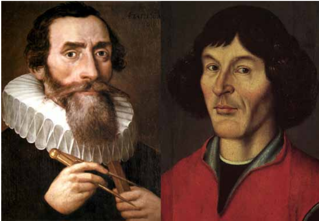
Johannes Kepler (tv.) & Nicolaus Kopernikus (th.)

I naturvidenskabelige kredse er det en udbredt opfattelse, at menneskehedens astronomiske indsigt først er opnået i nyere tid. Renæssancens store astronom, Kopernikus, der præsenterede verden for en teori om, at planeterne kredsedede omkring Solen og ikke omkring Jorden, vendte op og ned på Kirkens og Middelalderens naturvidenskabelige verdensbillede. Kopernikus indrømmede senere åbent, at hans "revolutionære" opdagelse var et resultat af hans studier af de gamle egypteres optegnelser – herunder visdomsguden Tehutis (græsk: Thoth) eller Hermes Trismegistos' arbejde. Samme indrømmelse får man fra det 17. århundredes matematiker, Kepler, som erkendte, at hans formulering af lovene for planeternes kredsløb stort set var kopieret fra de gamle egyptere.