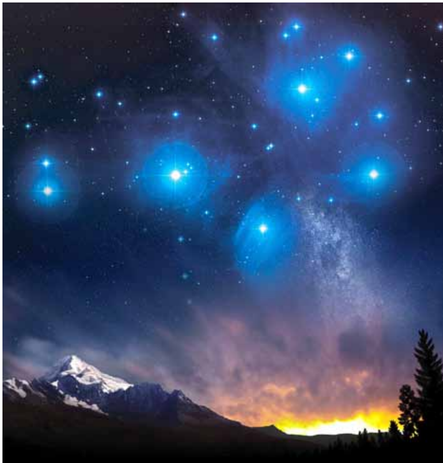
De syv søstre eller jomfruer

Den store pyramide ved Giza er som sagt orienteret mod både Store Bjørn og Plejaderne, og dermed bliver koordineringen speciel, for pyramiden bliver på denne måde et fokuspunkt på Jorden for det elektriske maskuline åndsprincip og det magnetiske feminine formprincip.