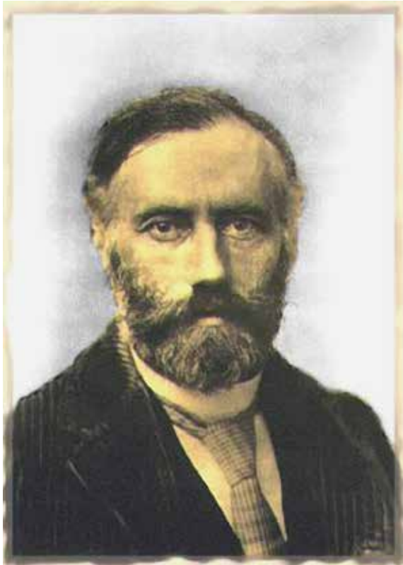
William Q. Judge