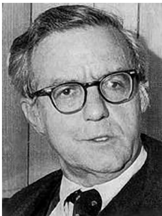
Dr. Ian Stevenson

"Hvis jeg var i stand til at huske hundreder af mine tidligere inkarnationer, som eksempelvis et liv som bondemand i Babylon, hofnar ved kong Philips hof, et kort liv i Dickens England eller som en ulykkelig russisk prinsesse – det ville jeg ikke være i stand til at bære? En af de største gaver, Skaberen har givet, er den barmhjertige glemsel af ofte grusomme og tragiske liv. Nej – man har nok i bevidstheden om dette liv."