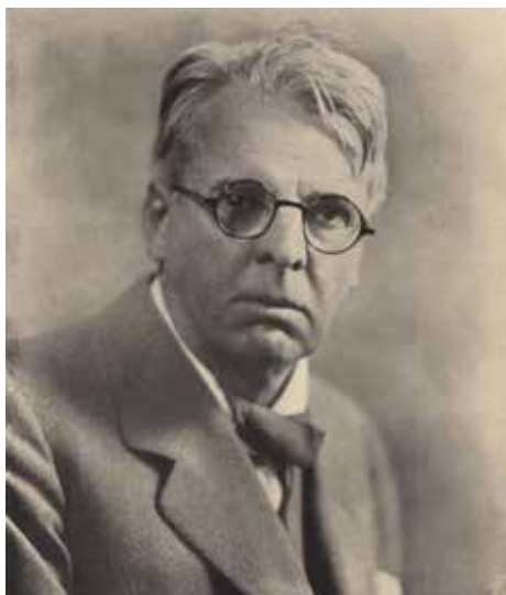
William B. Yeats

Kunstmalerne Paul Gauguin, Wassili Kandinsky, Piet Mondrian og Paul Klee har alle udtalt sig anerkendende om reinkarnationstanken på hver deres måde.