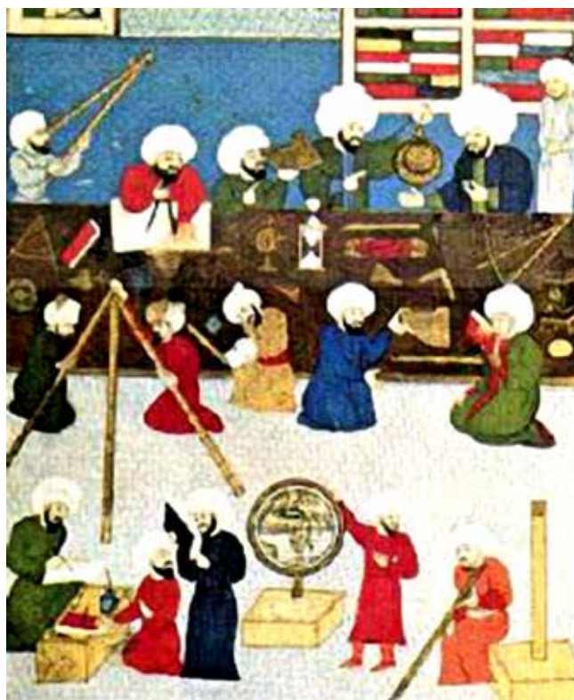
Arabiske astronomer og astrologer

Flere amerikanske præsidenter fra Kennedy og fremefter har benyttet sig af det også astrologiorienterede medium Jeanne Dixon, som ikke har nøjedes med at udsende forudsigelser pr. pressemeddelelse, men var ofte direkte på besøg i Det hvide Hus' præsidentbolig i Washington, D.C. – Senere blev præsident Ronald Reagan og især hans hustru Nancy jævnligt kritiseret i medierne for at rådføre sig for meget med en astrolog.