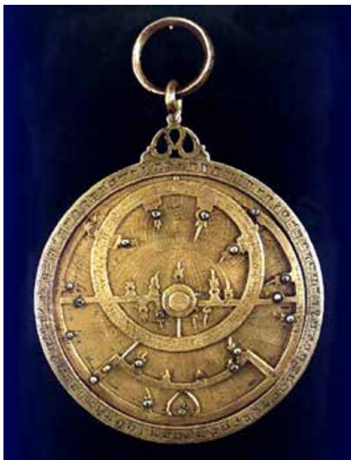
Astronomisk sigte- og beregningsinstrument, et 'astrolabium' fra 1300-1400-tallet.

Yderligere information: www.moses-egypt.net