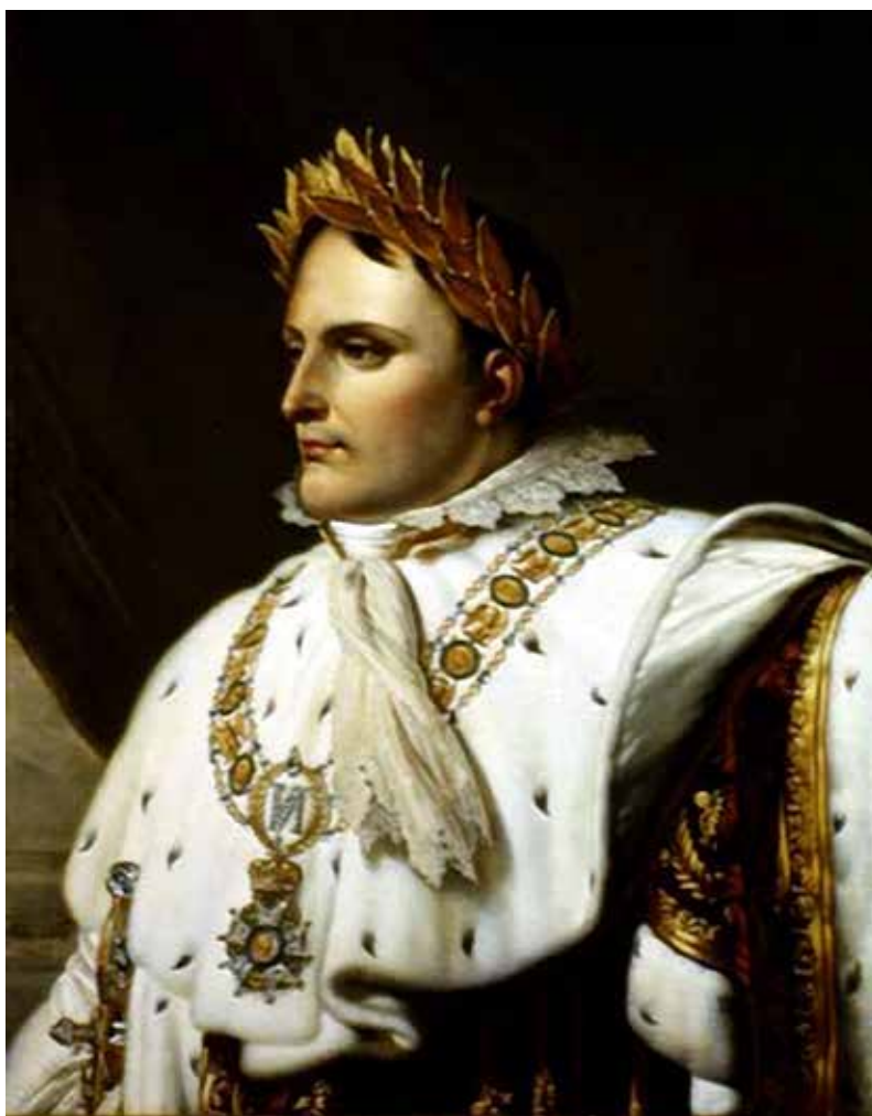
Napoleon talte ofte om indflydelse fra "sin skæbnestjerne".

Hvad var Napoleons "skæbnestjerne"? Var det fordi, han var født 15. august 1769? Det viser sig, at Napoleon her blev født en bestemt dag, hvor Løvens hovedstjerne Basiliskos/Regulus blev passeret af Solen i en, dog 3 grader åben, konjunktion. Igen, datidens stjernemytologiske tradition anså dette, under rette betingelser, at være tilknyttet en stærkt berømmelig karriere.