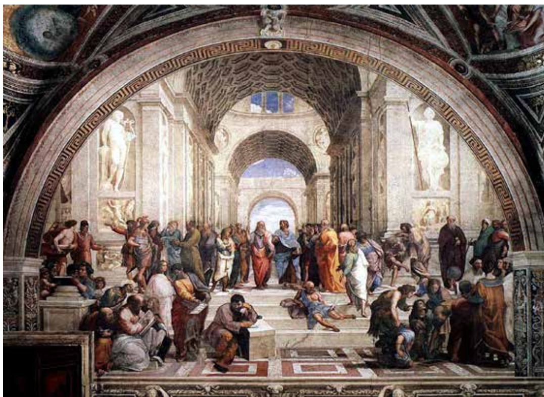
Filosofiskolen i Athen, malet af Raphael. Her diskuterede de lærde både stjernelære og matematisk astronomi.

Gennem historien, faktisk helt frem til 1800-tallet, kunne astrologi ses lige så involveret i politik som f.eks. økonomiske hensyn - foruden at være en stærkt udbredt og selvfølgelig faktor i livssyn og i dagligdagen ligesom religionen. Ofte kendes astrologien næsten ikke i historiebøgerne, hvilket i realiteten kunne svare til f.eks. at undlade at omtale den katolske kirke i kulturhistorien.