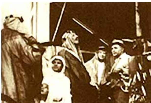
Den høje person midt i billedet: Kong Ibn Saud Abdul Aziz, i Dammam i 1939.

Disse olieaftalers tilblivelse i Saudi-Arabien fra dagen(e) efter den 12. februar 1945 var i deres udformning grundlæggende, men er derudfra blevet revideret flere gange siden. Den første såkaldte "oliekrise" indtraf den 22. oktober 1973 – hvor Saudi-Arabien med det afgørende ord, foruden Persien og 5 andre mellemøstlige olielande, iværksatte en embargo, dvs. lukkede af i en periode for olieeksport til USA og Europa.