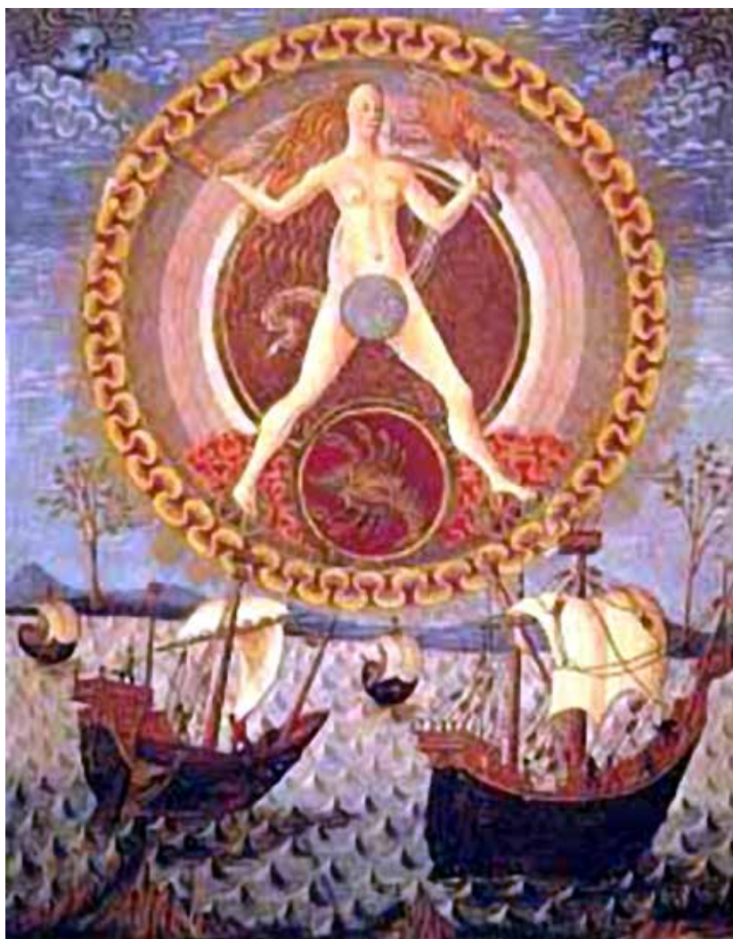
For at navigere efter stjernerne skulle solhøjden måles om dagen.