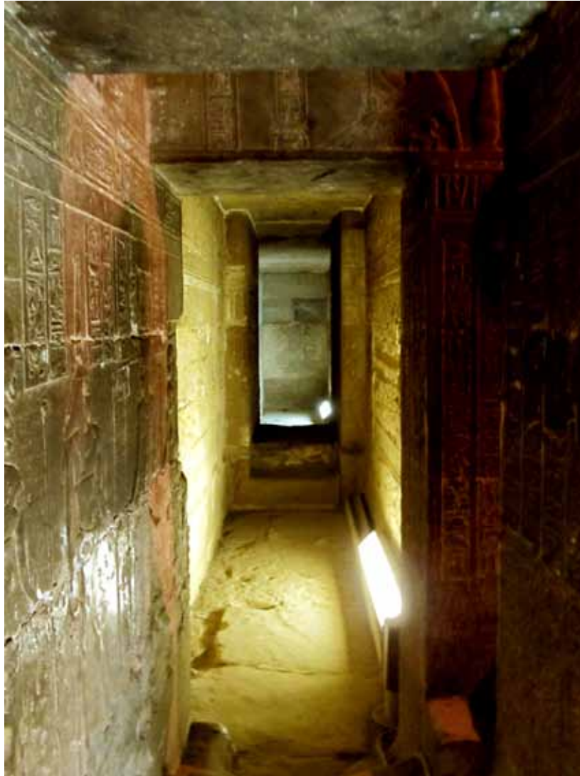
Tempelkrypten under Hathor-templet i Dendara