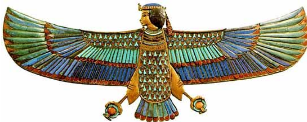
Ba-fuglen – et symbol på sjælen

"Selv præsterne havde ikke uden videre adgang til indvielse. Egypterne betroede ikke "mysteriernes" indsigt til alle og enhver, og de udvandede heller ikke hemmelighederne i de guddommelige emner ved at åbne dem for de profane. De reserverede dem til den retmæssige arving til tronen og til de præster, der kvalificerede sig via moral og visdom." 2