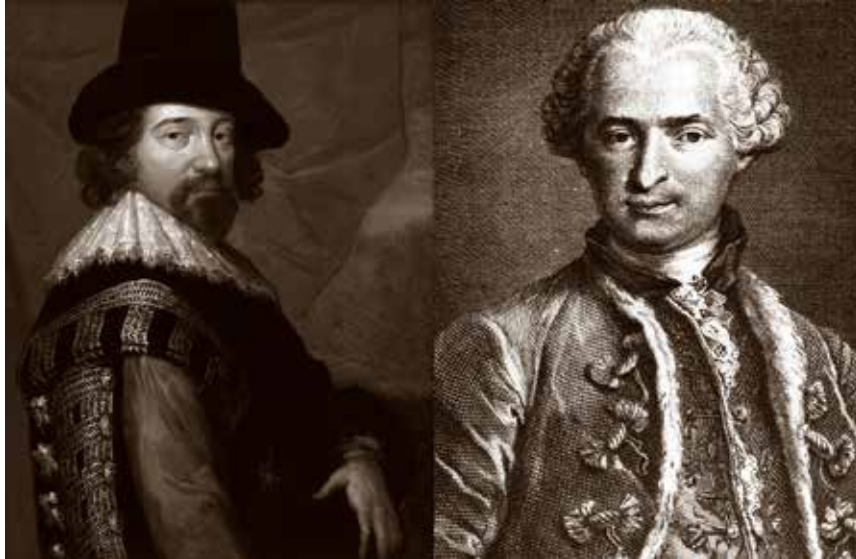
Francis Bacon (tv.) og Saint Germain (th.)