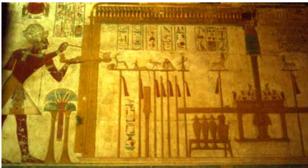
Ceremonielle kraftstave. Relief i Sethos I's Osiris-tempel i Abydos.

Men hvorfor er ankh-korset et Isis-symbol? Menneskets første forestilling om undfangelse er feminin, fordi det kender sin moder bedre end sin fader. Derfor var gudinder ofte mere hellige end guder. Naturen feminin og til en vis grad objektiv og håndgribelig, mens det åndelige princip, som befrugter den, er skjult, subjektiv og uhåndgribelig.