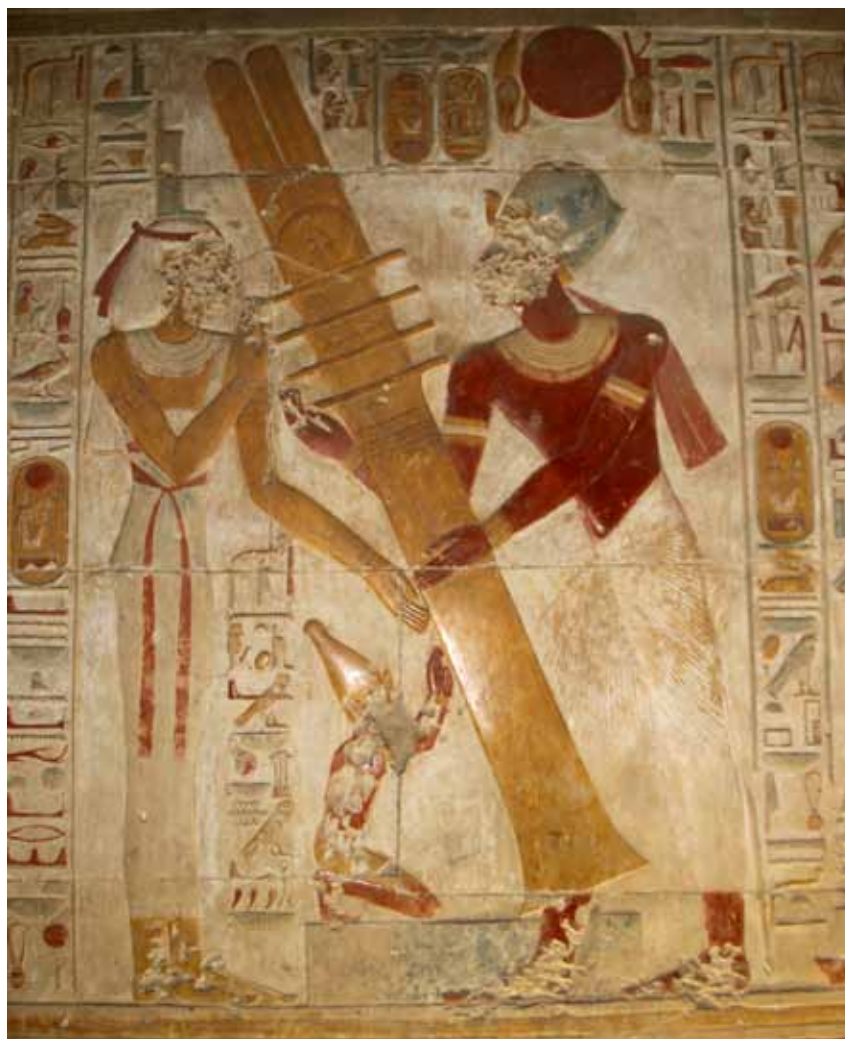
Rejsning af djed-søjlen. Relief i Sethos I's Osiris-tempel i Abydos.