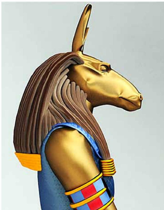
Den "onde" gud Seth

onde. Årsagen er, at den skabende handling reelt er oprindelsen til det onde. Den livgivende saft og kraft deler helheden mens modsætningerne udvikles.