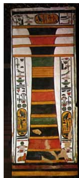
Djed-søjle. Relief i Nefertaris' grav i Luxor.

En tredje og vigtig kraftstav var djed-søjlen. I Egypten var djed-søjlen en almindelig hieroglyf, som findes i tekster fra de tidligste til de seneste perioder. Djed-søjlen symboliserer de fire elementers verden – altså menneskets fysiske verden, men her gælder det samme som med andre egyptiske symboler, at denne fortolkning er alt for overfladisk. Forskerne oplyser, at djed-søjlen symboliserer " stabilitet ". Årsagen er, at djed-søjlen bl.a. findes i en inskription på Senuserets monument, og ifølge denne inskription giver djed-søjlen " liv og stabilitet ".