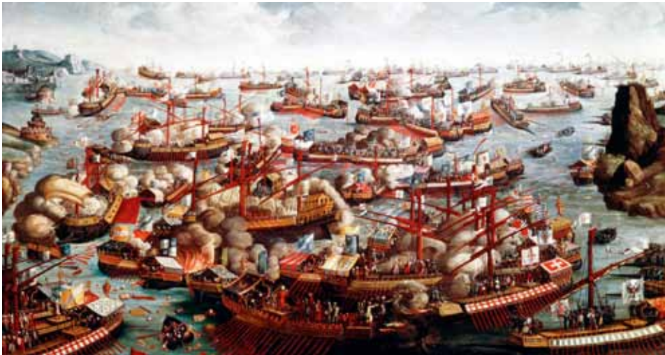
Slaget ved Lepanto i 1571

kan man nævne den ottomanske invasion og besættelse af det sydøstlige Europa fra ca. 1200-1400, der havde indflydelse på Serbien fra 1380 til 1878.