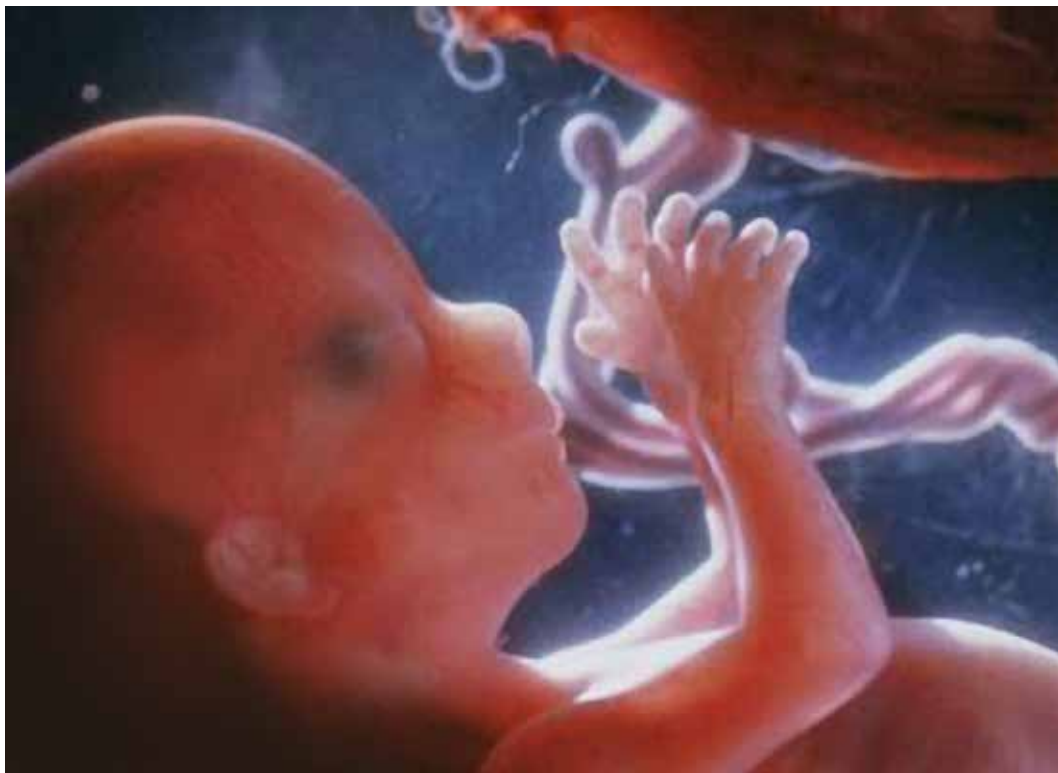
Foster i fjerde måned.

Ved fosterets fjerde måned så det nye mentallegeme næsten helt farveløst ud. Det havde svage konturer og nærmest en oval form. Et svagt farvespil gav en antydning af kulører på overfladen. I fosterets indre kunne man skimte meget svage lysegule, grønne, rosa og blå skygger med violet omkring den øverste del. Skyggerne var så svage, at de snarere var antydninger end egentlige farver – det var skygger, der antyder et nyt mentallegemes særpræg.