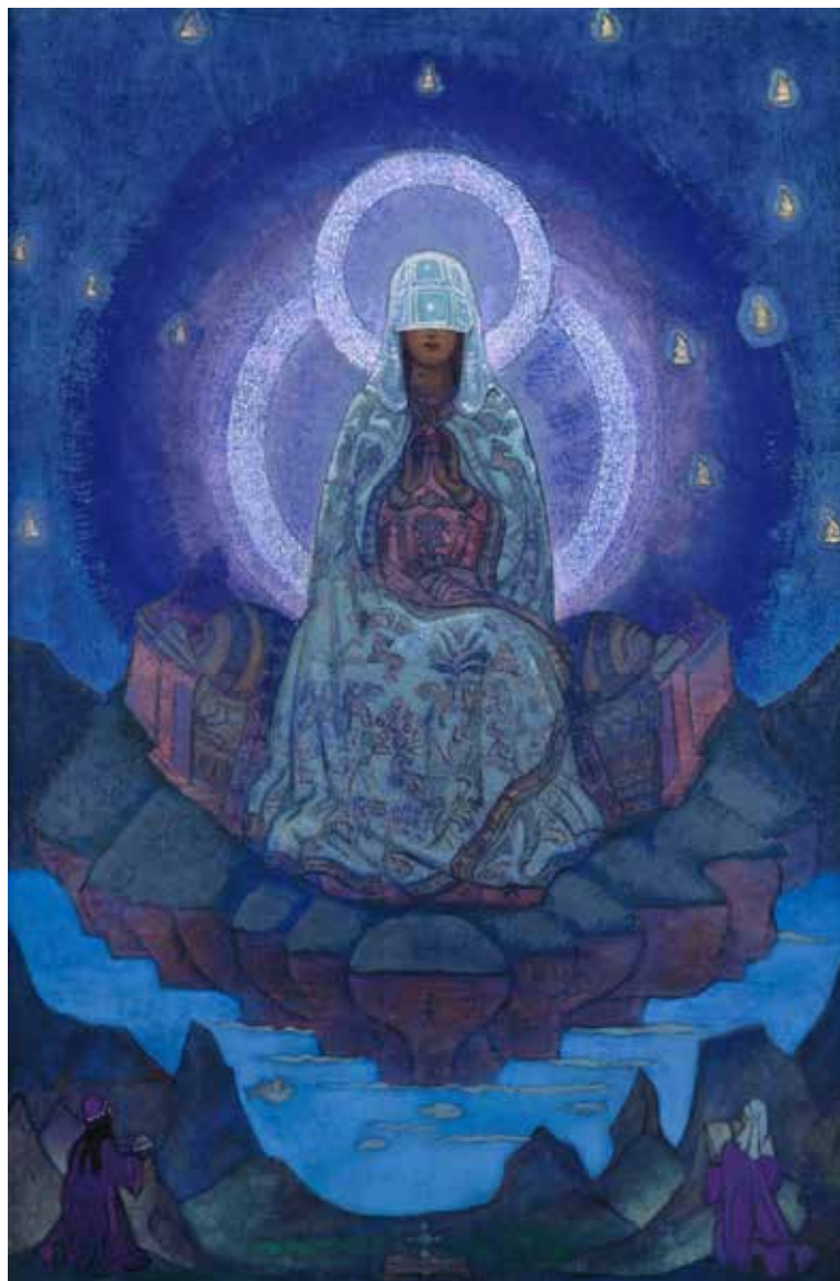
Verdensmoderen – maleri af Nicholas Roerich.

Den ændring i devaens udseende, der fandt sted under observationen ved ottende måned, blev skabt af nedstrømningen af en kraft fra højere verdener, som passerede gennem devaen og ind i moderen og barnet. Et forsøg på at udforske dens udspring bragte iagttageren til et bevidsthedstrin, der normalt lå uden for rækkevidde, og på disse åndelige niveauer blev tilstedeværelsen åbenbart af den personificering af guddommens feminine aspekt, som tidligere folkeslag kendte som Isis, Venus, Ishtar osv. og i nutiden som Jomfru Maria. Selv med iagttagers relativt uerfarne og ufuldstændige syn var en del af hendes strålende skønhed og fuldkommenhed helt tydelig. Hun var strålende smuk ud over al beskrivelse og tonede frem som inkarnationen af fuldkommen kvindelighed, en apoteose (forherligelse) af skønhed, kærlighed og ømhed. Guddommelighedens stråleglans var overalt omkring hende. En intens lykkefølelse, en ekstatiske åndelig glæde strålede ud af hendes smukke øjne.