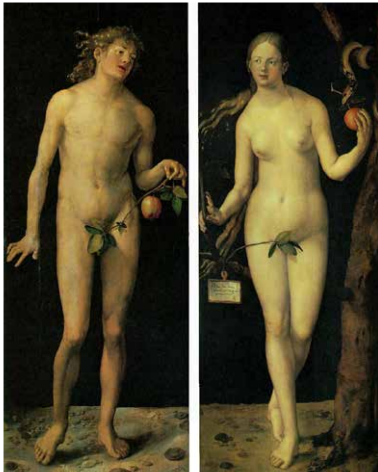
Adam og Eva

Men på den anden side er en undertrykkelse af det seksuelle instinkt lige så farligt. Psykologien har dokumenteret, at en lidenskab, der undertrykkes med magt, ikke overvindes men betvinges . Overvindelse er kun mulig, når modstanderen er afvæbnet af en mere kraftfuld udgave af denne vitale kraft.