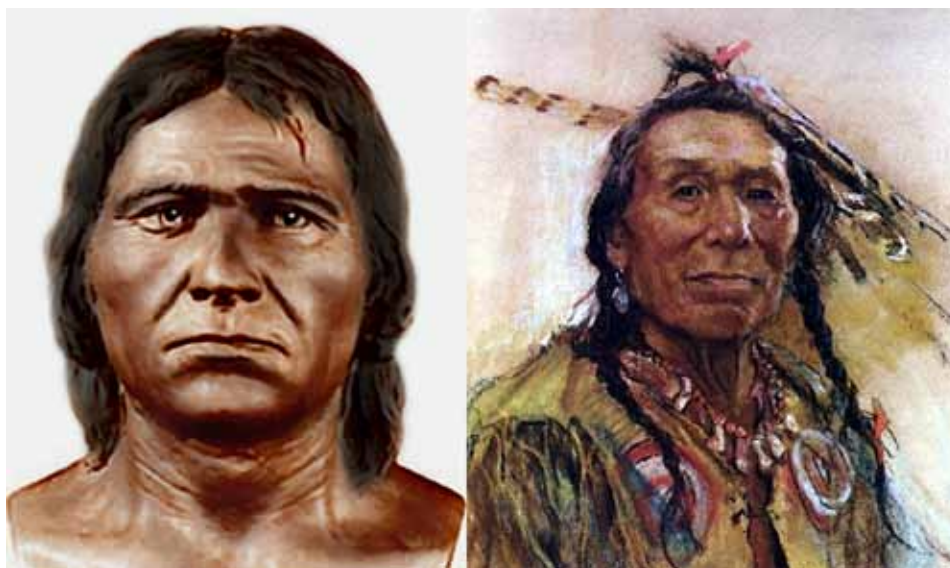
Cro-Magnon - American Museum of Natural History (tv.). Indianer (th.)

I nutiden er det alene "afrocentrikerne" – en nærmest sygelig betegnelse på de, der nægter at acceptere eurocentrikerens akademiske racisme og "kolonisering af verdenshistorien" – som fortsat holder fast ved akademikerens tidligere etablerede forskel mellem den sorte Grimaldi-type og den lysere Cro Magnon-type.