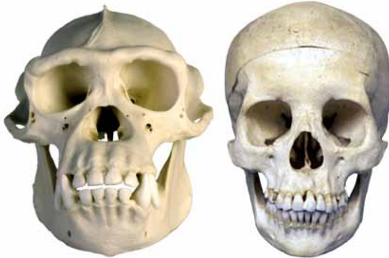
Kranier af chimpanse (tv.) og homo sapiens (th.)

Det er ikke helt klart, hvornår præcist de eurocentriske akademikere begyndte at fuske med veletablerede fakta, fortolkninger og begreber, men i 1970/80-tallet forsvandt Grimaldi-typen ud af kundskabsuniverset ved at blive inkluderet i Cro Magnon-begrebet.