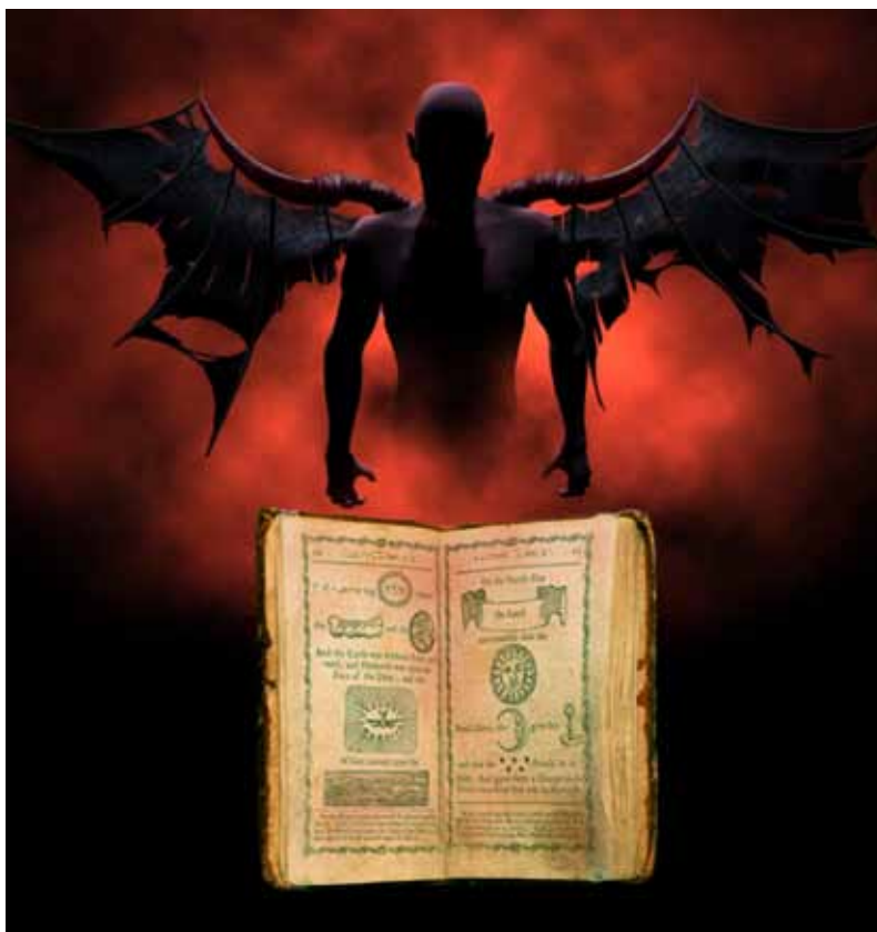
Kirken mente, at Corpus Hermeticum var Djævelens værk.

blev den omarbejdet efter gamle hebraiske og fønikiske håndskrifter af en jødisk kabbalist og kaldt Enoks Bog – men selv af dens forvanskede rester kan man se, hvor nøjagtig dens tekst stemmer overens med den ældgamle lære. Det fremgår eksempelvis af dens skildring af skabelsen ... 2