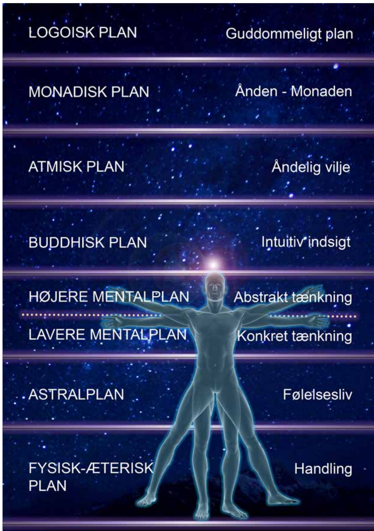
De syv eksistensplaner