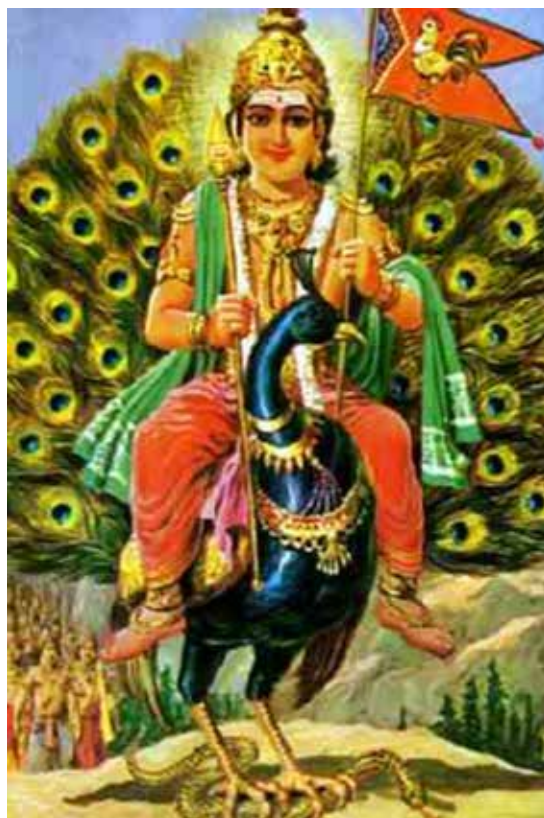
Karthik – bror til Ganesh

Ganeshs erkendelse af alle skabningers kilde og center er det, der gør ham til " den, der rydder forhindringer af vejen ". Der er ikke tale om en ydre styrkepræstation, for det drejer sig om hans indre erkendelse, og det er det, der gør ham til overhoved for alle skabninger. Legenden om Ganesh og hans kapløb er en allegori om den indre rejse, for det er den rejse, der er vigtigst. Det er de indre erkendelser, der fører mennesket derhen, hvor det skal hen, og de fører alle til det, der er behov for. Det er den indre virkelighed, der kan fjerne enhver forhindring. Og det er interessant at bemærke, at Ganeshs befordringsmiddel i kapløbet var sin ven, var den ydmyge mus, mens hans bror red på en påfugl. Symbolikken er indlysende. Ydmyghed er et centralt element i Ganeshs grænseløse styrke.