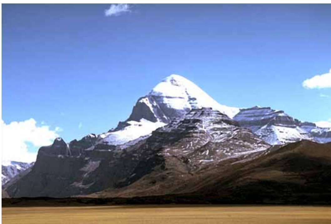
Mount Kailas i Wesak-dalen i Himalaya

I Himalaya ligger der en dal i et vildt og ubeboet område – ca. 600 kilometer vest for Lhasa og ikke langt fra Nepal. Det er Wesakdalen, som er omkranset af lave bjerge med spredte træer og buske. Dalen er aflang, bred mod syd og smallere mod nord, og mod nordøst er der en smal passage ud af dalen. I den nordlige ende ligger en stor flad klippeblok. Den er gråhvid med årer der glimter. Den er næsten 4 meter lang, to meter bred og 1 meter høj. Dalen er i virkeligheden en højslette, som er 2 km lang og halvt så bred. I den sydlige ende er der mørkegrønt stridt græs, der ligner et stort tæppe. Der løber et lille vandløb i den østlige side af dalen, og det fortsætter gennem den nordøstlige passage og videre ud i en klar blå sø nogle kilometer væk.