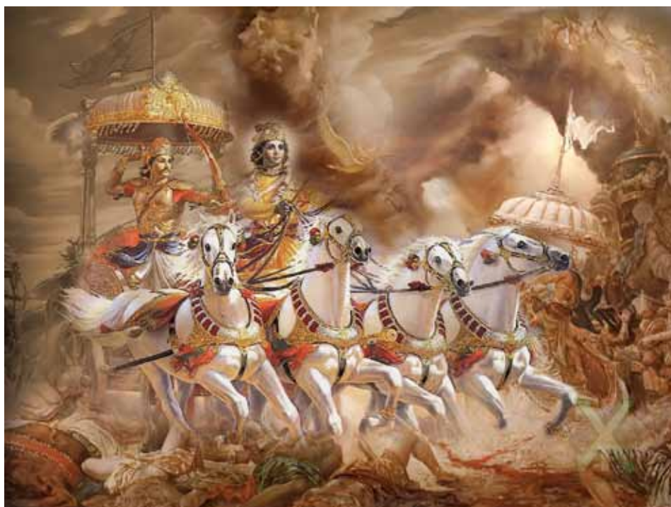
Den Krishna, der omtales i Mahabarata.

I samme periode levede den store filosof Pythagoras, som nu er mesteren Kuthumi. Han var ikke en af Herren Buddhas nærmeste disciple, for han havde allerede opnået Arhat-indvielsen, og derfor var der brug for hans arbejde andre steder. Men han rejste til Indien for at møde Buddha og modtage hans velsignelse. Han tilhører også Bodhisattvaens udviklingslinje (dvs. 2. stråle), og man kan betragte ham som en af Buddhas vigtigste ledende medarbejdere.