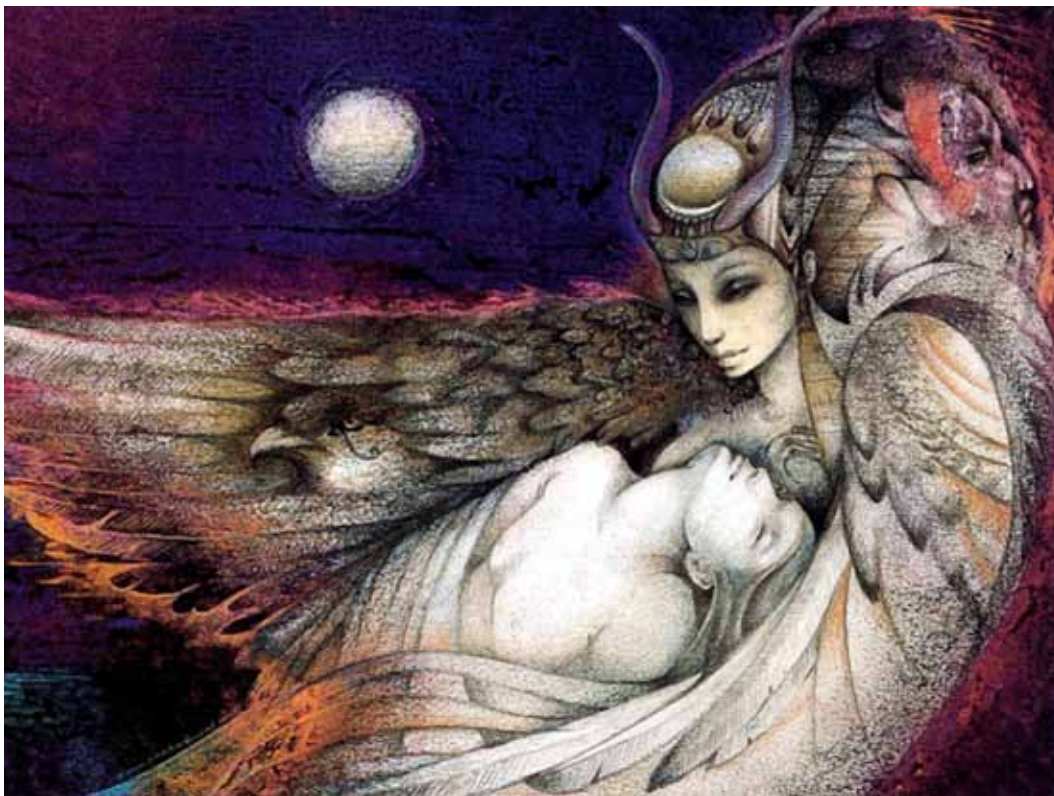
Osiris og Isis