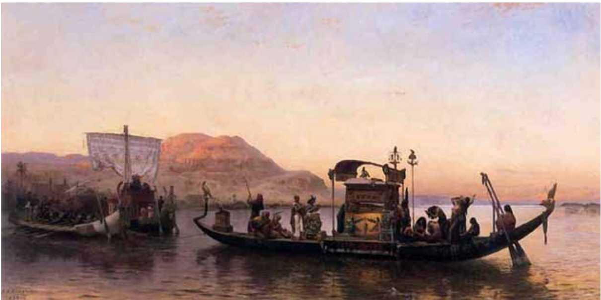
Den afdøde sejles til Vestbredden – "de dødes land"

Har nutidens menneske mistet forbindelsen til ægte og dybe sandheder – som f.eks. reinkarnation?