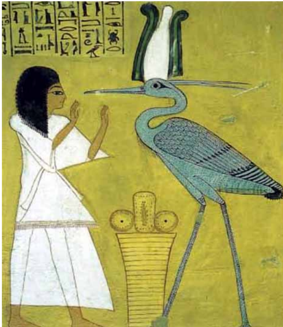
Benu-fuglen. Relief fra Inherkas grav.