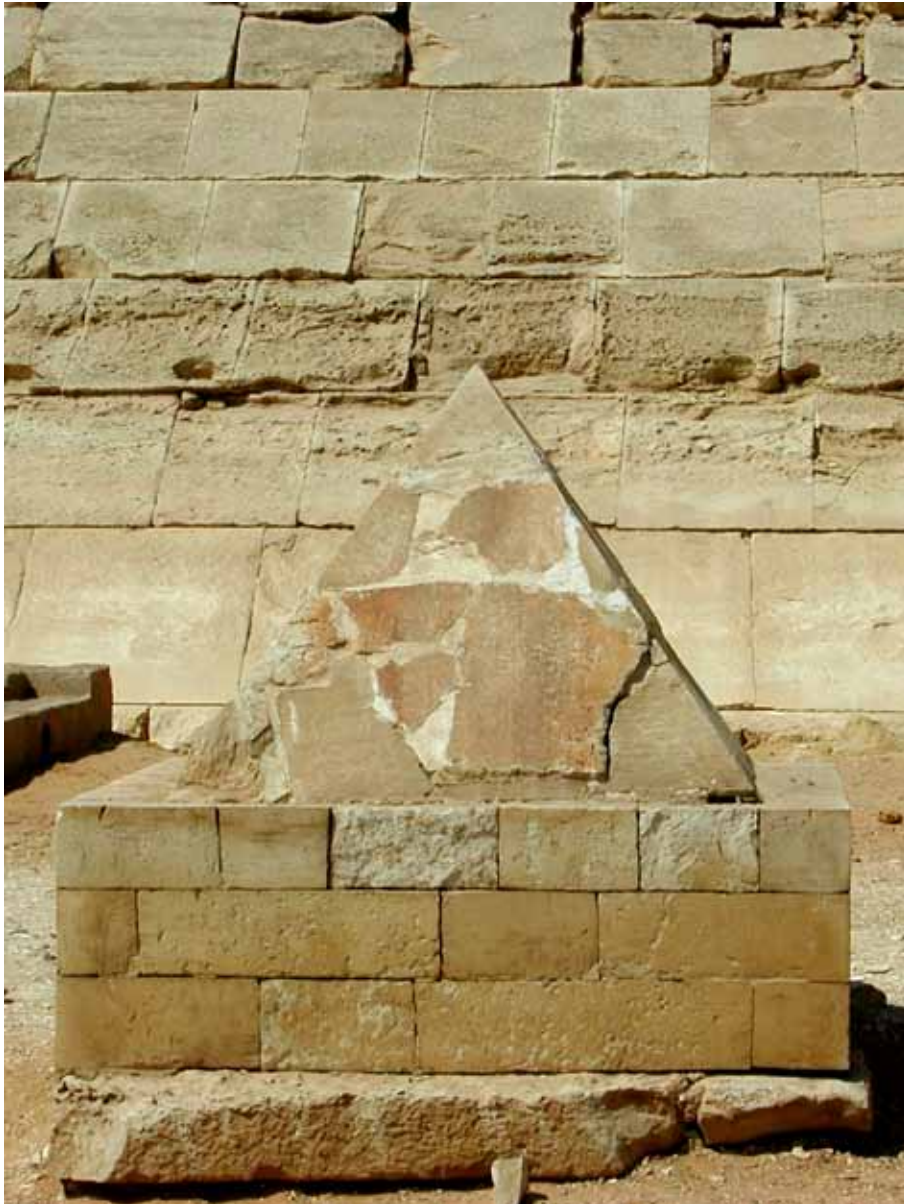
Topstenen fra "den røde pyramide" ved Dashur står ved pyramidens fod.

Det var denne lære, mestrene havde skjult i den store pyramides konstruktion. Da araberne i det 9. århundrede under ledelse af Abdullah el Mamoun brød ind i pyramiden, var det i håb om at finde de skriftruller eller inskriptioner, som rygterne berettede om, for de skulle indeholde vigtige informationer om menneskets udvikling og fremtid. Han drog skuffet bort uden at vide, at han faktisk fandt dem, for informationerne var skjult i selve konstruktionen.