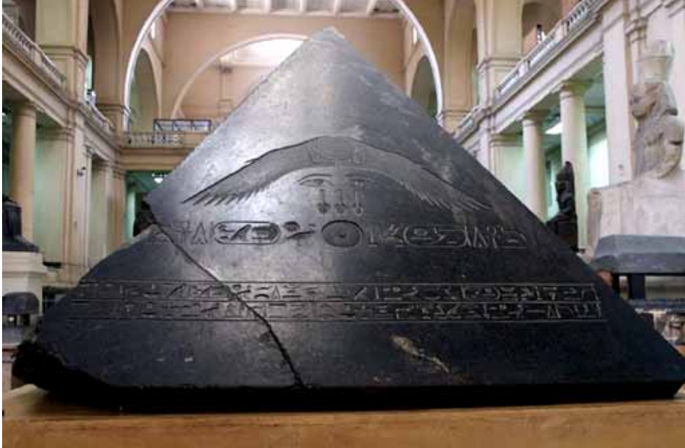
"Benu-sten" eller "pyramidion". Egyptian Museum i Cairo.