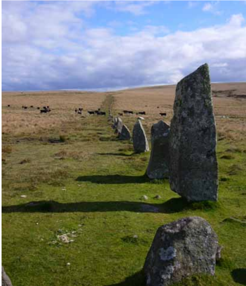
Sten, der er anbragt langs æteriske meridianer eller ley lines

Obeliskerne ved tempelporten repræsenterede på denne måde en trefoldighed, der bestod af ånd, sjæl og legeme, og denne trefoldighed er samtidig udtryk for menneskets totalitet. En gammel skrift oplyser: