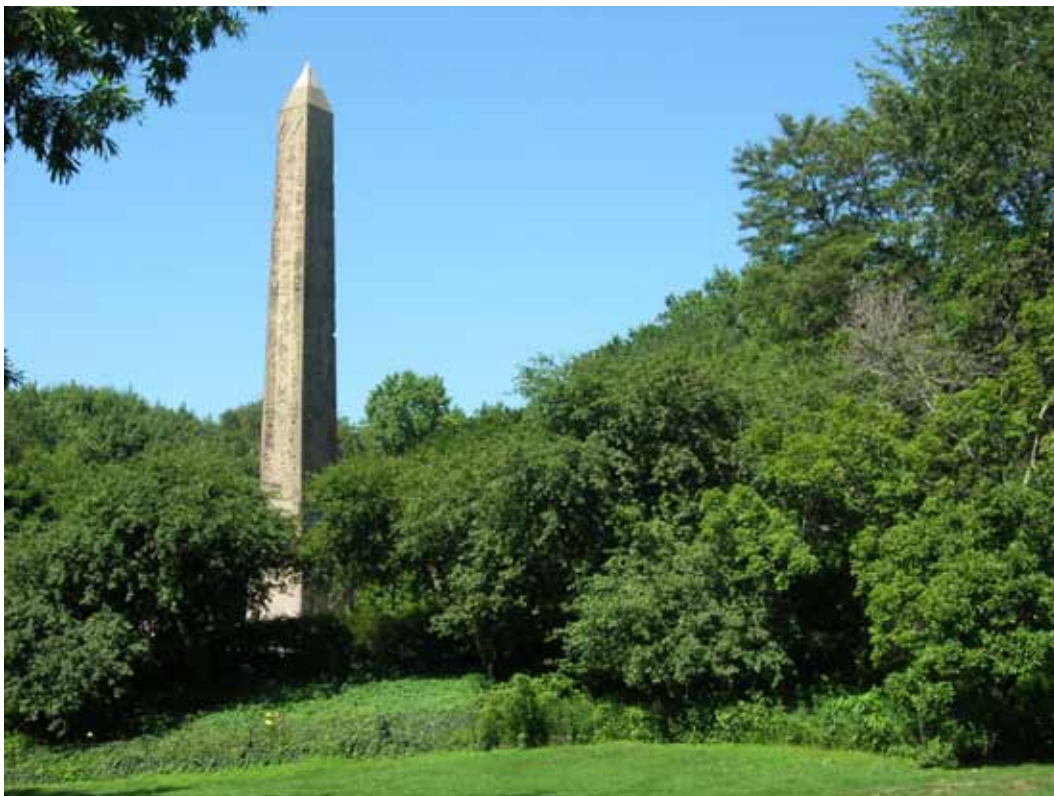
Den egyptiske obelisk i Central Park

Her stod de stadig, da den arabiske læge Abd-al-Latif besøgte Alexandria og kaldte dem " faraovens nåle ". De blev senere til " Cleopatras nåle ". Den ene af obeliskerne faldt ned fra sit fundament – sandsynligvis under et jordskælv i 1301 – hvor også Alexandrias mure faldt sammen. Og her lå den, indtil den i 1877 blev transporteret til England med det engelske obeliskskib "Cleopatra", der blev trukket af "s/s Olga". "Cleopatra" var et specialbygget skib, som uheldigvis kæntrede i Biscayabugten i et uvejr. Man troede, at det var sunket, men det blev senere fundet og taget på slæb.