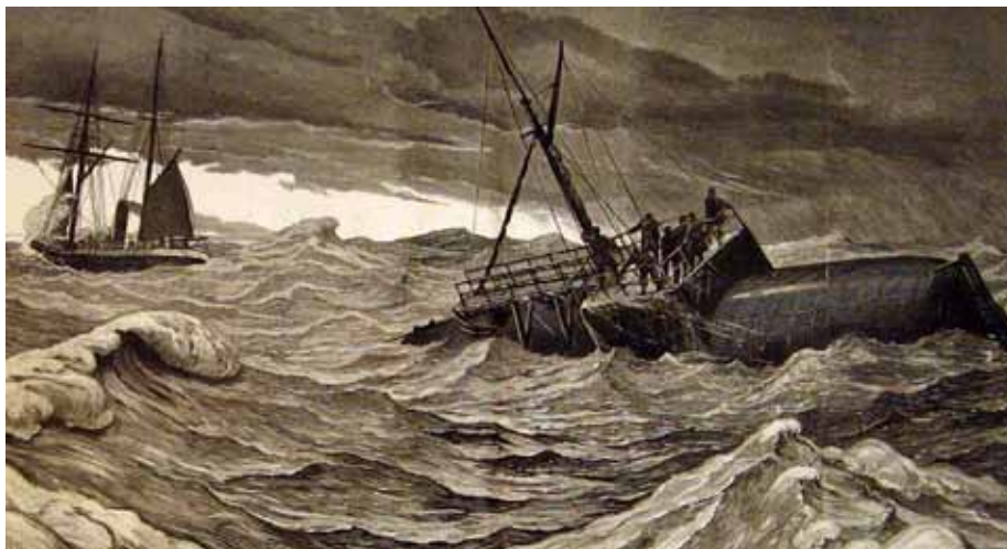
Det cylinderformede engelske obeliskskib "Cleopatra" på slæb

På Thames Embankment i London står der en mægtig obelisk på 186 tons. Den blev oprindeligt udhugget ca. 1500 f.Kr. under Tutmosis III. Den blev fragtet fra stenbruddet i Aswan til soltemplet i An eller On (grækernes Heliopolis og nutidens Giza ved Cairo). Her dannede den par med en lignende obelisk foran et tempel, der var dedikeret til Atum og Ra-Herakte. Her stod de to obelisker indtil kejser Augustus ca. 13. f.Kr. besluttede at flytte dem til Alexandria, hvor de blev opstillet ved indgangen til romernes Cæcarium.