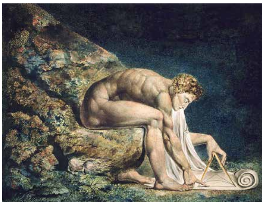
William Blake: Newton

Det skal kort nævnes, at for hvert symbol er der syv nøgler til fortolkning. Det svarer til de syv bevidsthedsplaner i solsystemet og de syv rodracer. Det siges, at hver nøgle skal "drejes syv gange" – én gang for hvert bevidsthedsplan eller rodrace.