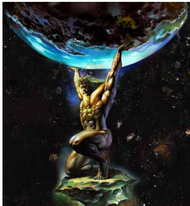
Myten om Atlas

Hvis åndelige sandheder skal overleve og være ved hånden, når enkelte mennesker er klar til at følge udviklingsvejen, er det ikke kun de lærde og de indviede, der skal kende de store sandheder. For at beskytte sandheden blandt de uvidende masser, er den præsenteret i form af myter, legender, lignelser, allegorier og fortællinger om guderne, og metoden er blevet anvendt så langt tilbage i tiden, som menneskeheden har optegnelser. Det sikrer, at menneskeheden ikke mangler mulighed for at blive instrueret, og når et menneske er klar til at gå den åndelige vej, er visdommens alfabetet lige ved hånden, og det kan bruges som vejleder og lærer. Desuden medfører metoden med at tilsløre den guddommelige visdom, at der udøves et kontinuerligt pres på menneskehedens fantasi, og sandheden vil aldrig gå tabt.