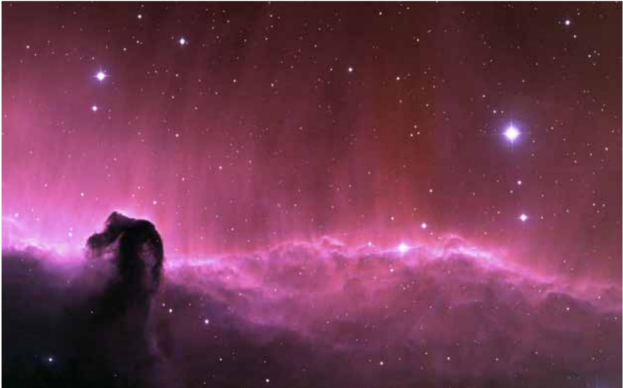
Hestehoved-stjernetågen – findes i stjernebilledet Orion.