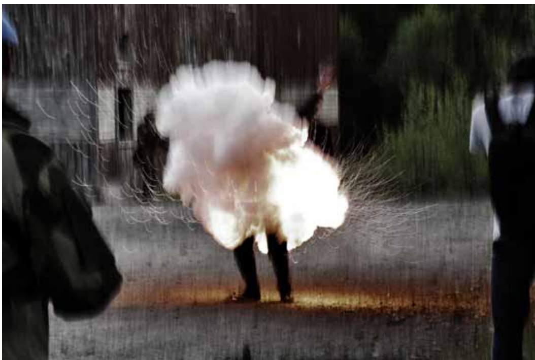
Selvordsterrorist udløser sin sprængladning

Et kastebaseret samfund med en krigerkaste, der monopoliserer vold, kæmper for et æreskodeks og kender følgen af vinde-tabe-begrebet, eksisterer ikke mere. I demokratier med ligeret for alle – uanset familiebaggrund og samfundsklasse – stiger det antal, der kan påtage sig roller i samfundet. Det samme gælder antallet af ofre og udøvere.