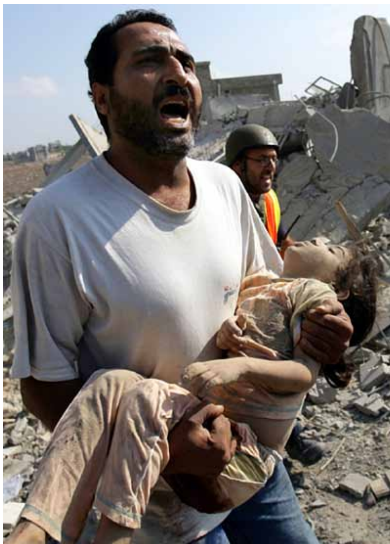
Fra Israels statsterror mod civilbefolkningen i Gaza