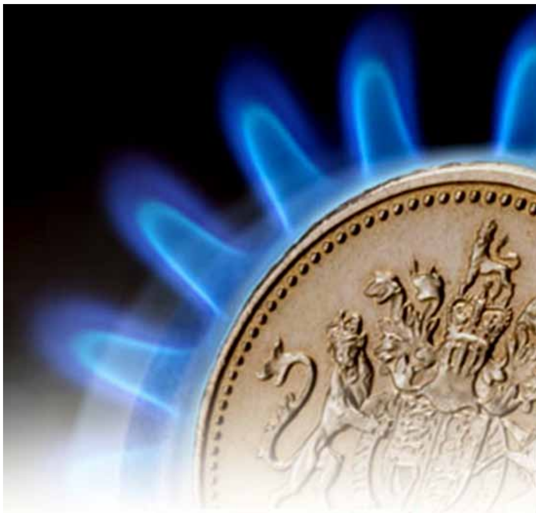
Penge er fortættet energi

Tiltrækning af penge til hierarkiske formål