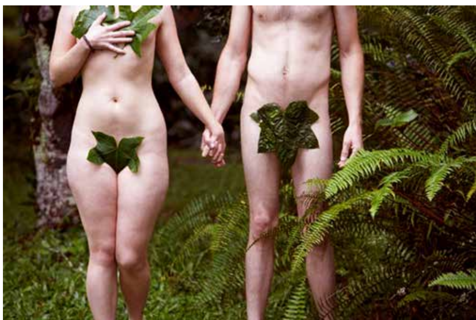
Da Adam og Eva blev bortvis fra Paradis, erfarede de den kønslige forskel

Det leder tanken hen på beretningen om Adam og Eva, som måtte forlade Paradisets have. Paradiset er netop et symbol på den tilstand af enhed, der eksisterede før Universets skabelse.