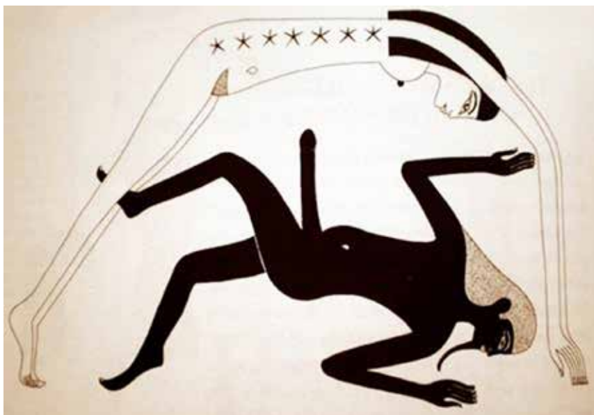
Himmel og Jord – Nut og Geb – symboliserede egypterne med seksuel forening