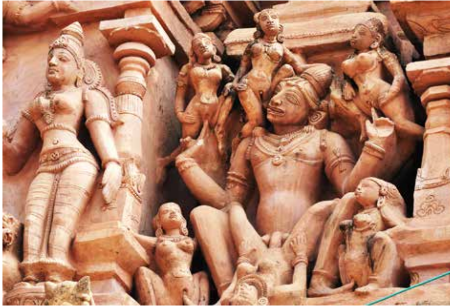
I Østen var seksualitet forbundet med princippet om foreningen af ånd og stof