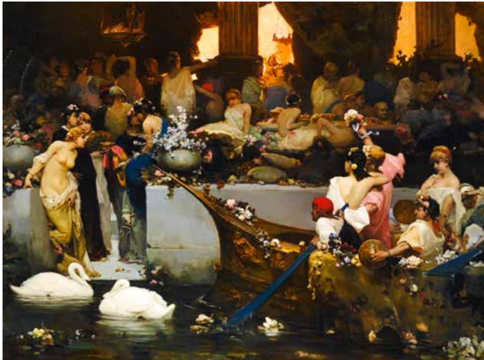
I Romerriget var drukkefester og sexorgier almindeligt