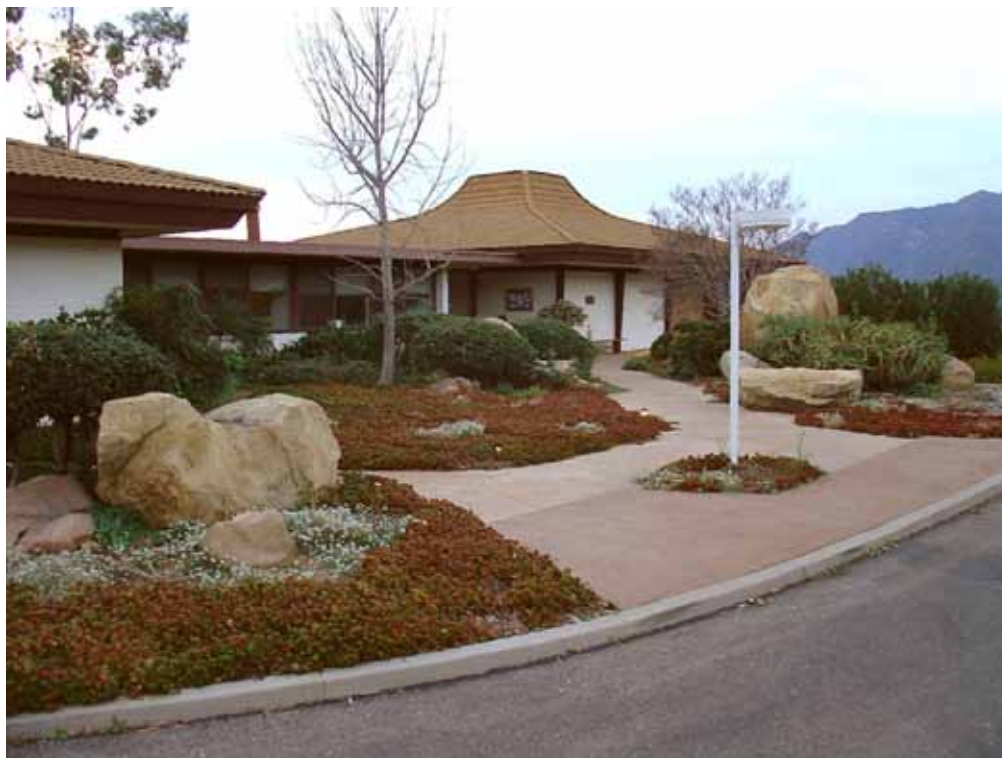
Meditation Mount i Ojai-dalen, Californien

Han bad Roberto Assagioli om at " – meditere meget på det, men ikke foretage sig noget før efter ... "