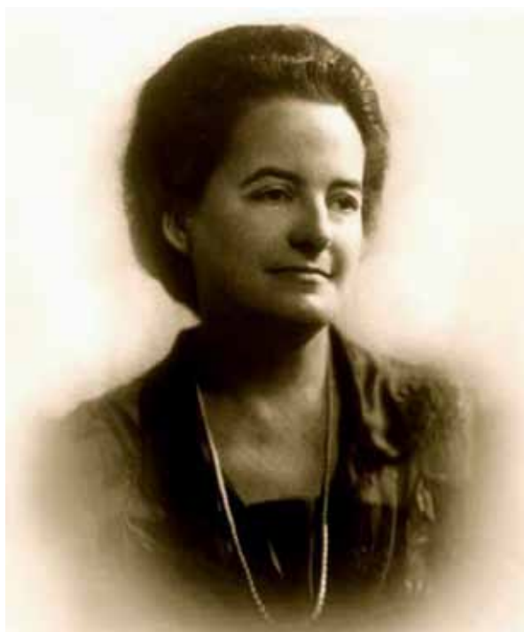
Alice Ann Bailey

Der findes en kerne af esoterisk viden, som traditionen tro er videregivet mundtligt i de farligste og mest undertrykkende tider, eller gennem hemmelige ordener som alkymisterne, tempelridderne, rosenkreuzerne, frimurerne og andre mindre kendte grupper, og denne viden gøres i dag tilgængelig via bøger og andre mere direkte kilder. Denne viden er almindelig kendt som "den evige visdom", "den tidløse visdom" eller "åndsvidenskab", og den fortæller om, at der foregår en stadig forædling af verden ved at menneskeheden frigør sig, sådan at den bevidst og disciplineret kan planlægge og skabe en ny verden i samarbejde med de evige, guddommelige kræfter (Gud), der har eksisteret siden tidernes morgen.