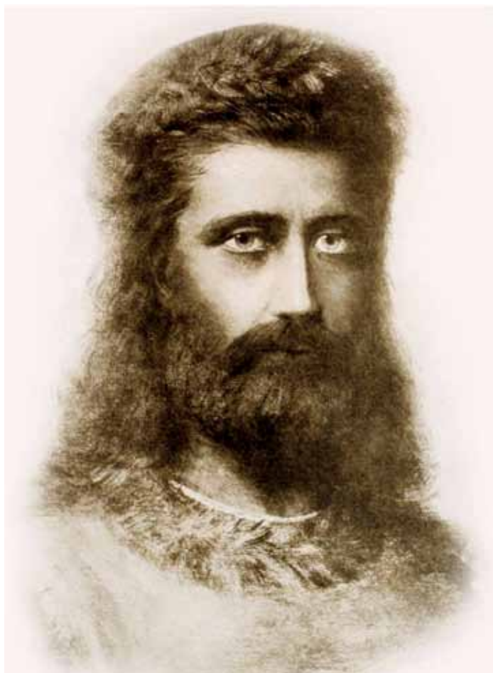
Mesteren Koot Hoomi

H.P. Blavatskys oplysninger – og hendes arbejde – tonede ud og overlevede kun i hendes arbejder og i Det Teosofiske Samfund , men i det 20. århundrede skete der en ny udvikling. En ung britisk kvinde ved navn Alice Ann Bailey – som dengang endnu var teenager – blev kontaktet af en usædvanlig kraftfuld asiat, som trådte ind ad hendes dør. Han var ikke inviteret, og han kom uanmeldt og fortalte hende i klare vendinger, hvad hendes opgave i livet ville blive. Hans navn var mesteren Koot Hoomi.