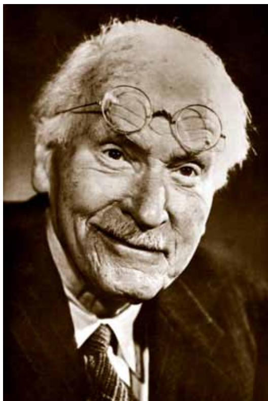
Carl Gustav Jung

Som det fremgår, kræver det en gennemgribende holdningsændring at bevæge sig fra en materialistisk psykologi til det postulat, at mennesket, sammen med hele livsstrømmen, bevæger sig frem imod et evolutionsmål, som i menneskets tilfælde består i at realisere sig selv. Det bringer psykologien på linje med religiøs stræben. På samme måde indebærer postulatet, at selvom menneskets lavere "ego" faktisk er individuelt og adskilt, smelter dets højere selv efterhånden sammen med det ene universelle liv – og det er en erkendelse af, at menneskets fulde bevidsthed og integration involverer alle den dybe mystiske tilstands kræfter, kvaliteter og evner.