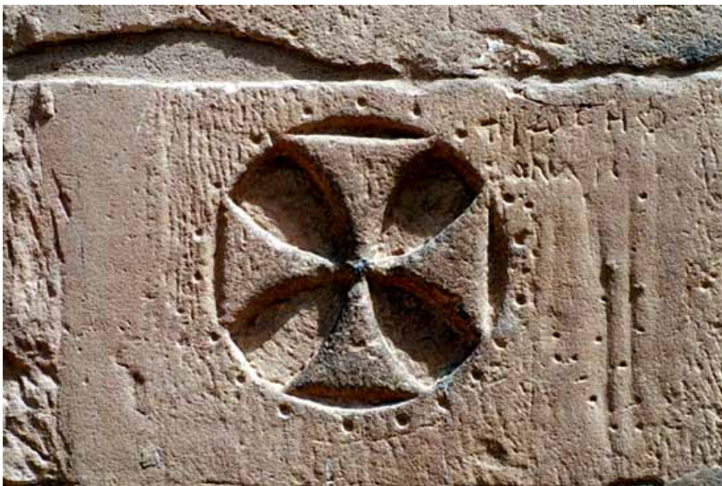
Koptisk kors udhugget i Isis-templet på Philae-øen

Den kristne religion har gjort Jesu korsfæstelse til den vigtigste del af sin dogmatik. Kirkens symbol er det kors, Jesus blev henrettet på, men symbolet tilhører i virkeligheden menneskeheden og Jorden. Planeten Jordens kors er ligearmet . Korsets fire arme er i ligevægt. Det har de samme proportioner, og det symboliserer tallet fire. Det fysiske stof vibrerer i overensstemmelse med dette tal. Der er fire elementer, fire verdenshjørner, fire naturriger osv. Det afbalancerede kors er både Jordens og Jesu sande symbol. De første kristne – de egyptiske koptere – benyttede et ligearmet kors. Det kan bl.a. ses mejslet ind i væggene i Isis-templet på øen Philae ved Aswan. Nutidens kristne kors er ikke i ligevægt, og det afspejler den åndelige ubalance, som menneskeheden i nutiden befinder sig i.