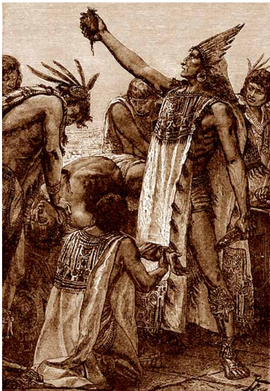
Menneskeofring var en religiøs praksis, der forekom hos Aztekerne og i andre kulturer, og formålet var også at formilde Gud.

det hele taget sætter spørgsmålstegn ved Guds eksistens – straffer den alkærlige kristne Gud synderne med et evigt ophold i et forfærdeligt helvede – altså en straf, der er helt ude af proportion med forseelsen.