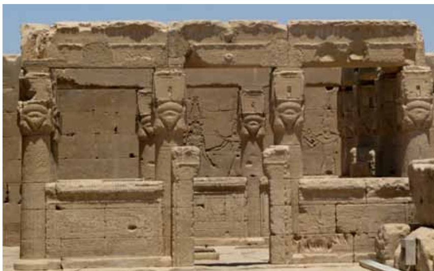
Mammisi på taget af Hathor-templet i Dendara

"Der er glæde i Himlen, Jorden danser, de hellige musikanter lovpriser."