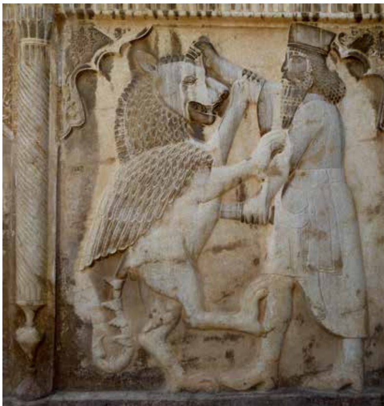
Persisk relief. Kongen i kamp mod det onde.

I det gamle Egypten antog det onde mange skikkelser. I Dødebogen kan man eksempelvis se i hvor høj grad egypterens liv – især når det drejede sig om livet efter døden – var fyldt med faretruende dæmoner, der kunne være vanskelige at besejre, og de kunne kun uskadeliggøres af mennesker med kendskab til de ceremonielle kraftords store magt. Ifølge de gamle egypteres synspunkt var der ingen tvivl om det ondes eller de mørke kræfters realitet. Derfor herskede der evig strid mellem Osiris, Isis og Horus på den ene side og Osiris' onde broder Seth på den anden.