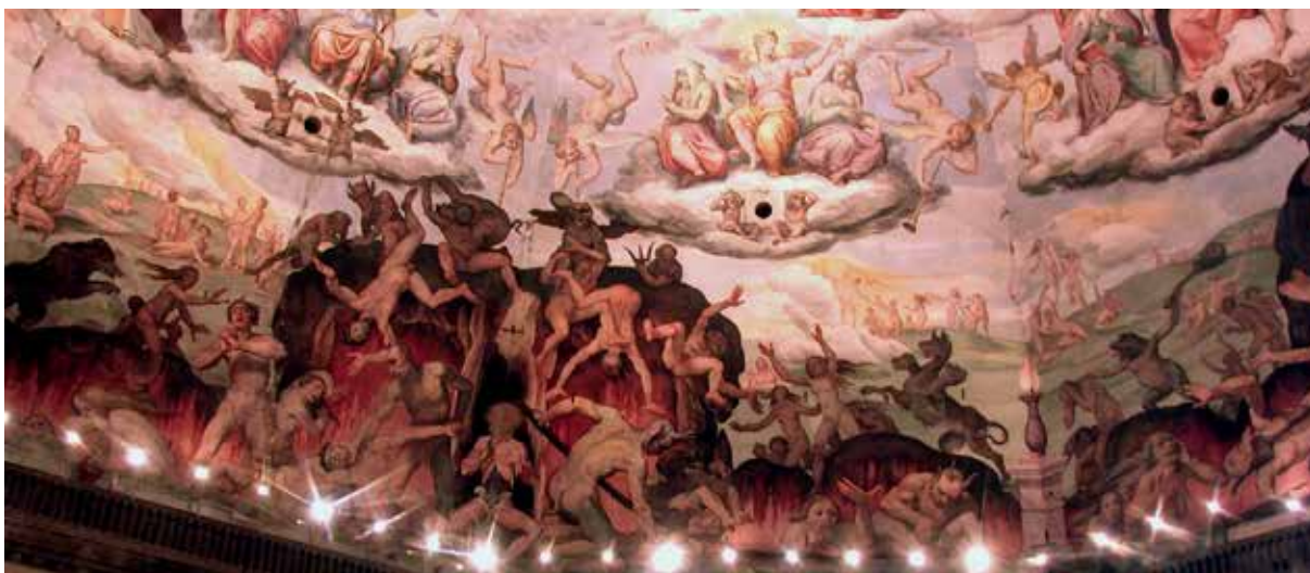
Den kristne opfattelse af Himlen og Helvede - de gode og de onde.

I filosofiens historie ser man naturligvis ihærdige forsøg på at løse problemet med det onde, som i højere grad end noget andet af filosofiens problemer påvirker den daglige tilværelse direkte. Her drejer det sig ikke om uklare abstraktioner, som kun er af interesse for sofistikerede teologer eller filosoffer, der iagttager dagliglivets problemer på passende afstand. Oplevelsen af det onde som en magt, der modarbejder det gode – og erkendelsen af, at der i mennesket raser en uafbrudt kamp mellem åndelig stræben og fysiske begær – er alt for virkelig til at kunne ignoreres. Hver eneste dag er mennesket i en eller andet grad bevidst om på den ene side sin egen vilje og sine egne beslutninger, og på den anden side en magt, der modarbejder både vilje og beslutninger – ja og oven i købet lokker mennesket væk fra det mål, det har sat sig. I alle folkeslag og i alle tidsaldres litteratur vrimler det med eksempler på denne kamp mellem godt og ondt – om ædel aspiration og uværdigt begær i menneskets liv. Der er ikke mange af litteraturens værker, hvor man ikke møder dette tema i en eller anden form. Hvert eneste menneskes liv er bare et kapitel af dette evige epos om kampen mellem godt og ondt. Bevidstheden om denne strid er udtrykt med stor dramatik af Paulus: