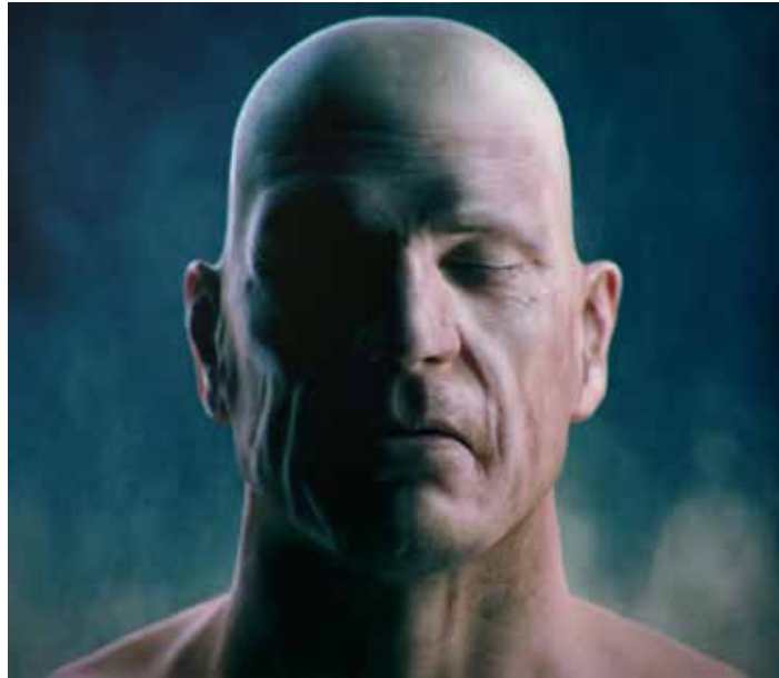
Gennemsnitsmennesket går med "lukkede øjne"