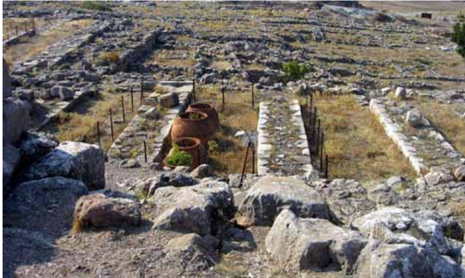
Hittiternes hovedstad ved Boghazköy