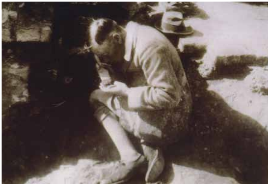
Sir Leonard Woolley ved udgravningen af oldtidsbyen Uran

Velkendte træk! Men ser man ud over Noahs-ark-lignelsen og på selve helhederne i bibelberetningen, må man spørge: Hvad nyt er der ved forskningen om "historisk underbyggelse" og de såkaldte "sagn"? I forskningens barndom var det meget uheldigt, at teorier (i flere henseender stadig accepterede) om Bibelens tilblivelseshistorie blev etableret før , den videnskabelige arkæologi og historieanalyse var udviklet.