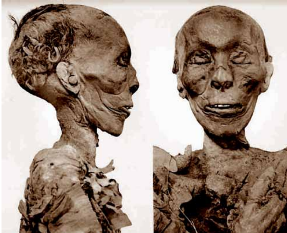
Tutmosis II – Moses' stedfar