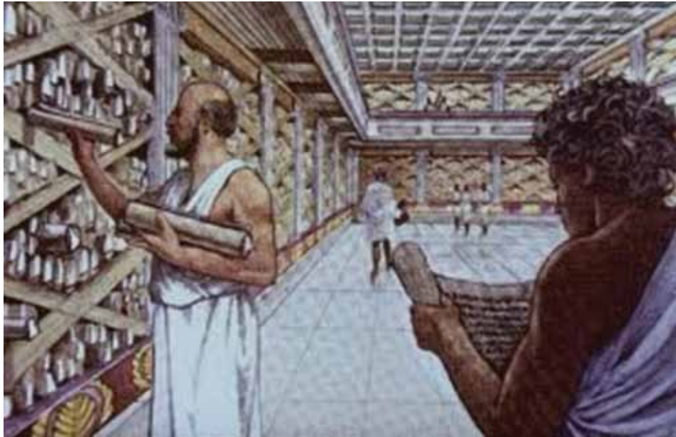
Biblioteket i Alexandria

Mange myteerklærede bibelforhold afklares i forfatterens bog Den Hemmelige Religion med bibelforskning sat over for nyorientering: Moses eksisterer fuldt logisk kildeplaceret i den historiske kontekst.