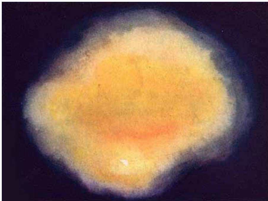
Et eksempel på en tankeform (fra Thought-Forms).

er skabt af, har sin egen udvikling som essens , men enheden, der midlertidigt er opbygget af essensen, har ingen evolution som selvstændig enhed, og den har ikke tilstrækkelig kraft til at reinkarnere. Elementalen kan snarere beskrives som et væsen, der for en tid består af liv og legeme, for stoffet og dets levende essens udgør et redskab, der er belivet af en tankeform . Elementalen fungerer som en separat enhed, og hvor længe den er i stand til at fungere selvstændigt, afhænger af den tankekraft, der er lagt i skabelse af tankeformen, for tankekraften er dens besjælende princip, og det er alene den, der opretholder formen.