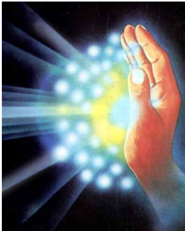
Prana-udstråling fra en healers hånd.

Det er nu hensigten at beskrive nogle af disse ukendte kræfter. Først og fremmest er der nerveæteren og strømmen af prana (vital energi) langs denne nerveæter. Begge energiformer kan underlægges menneskets vilje, og derfor kan man sige, at hypnose er en form for magi, for det er disse usynlige kræfter, der manipuleres af hypnotisørens vilje, og dermed skabes der synlige virkninger. Patientens eller forsøgspersonens tilstand kan i høj grad påvirkes. Det er ikke alene muligt at udløse forskellige former for illusioner, men lemmer kan også gøres stive og ufølsomme over for smerte, og et menneske kan bringes i dyb trance. Det er årsagen til, at man kan betragte disse to kræfter – nerveæter og prana – som magiske kræfter.