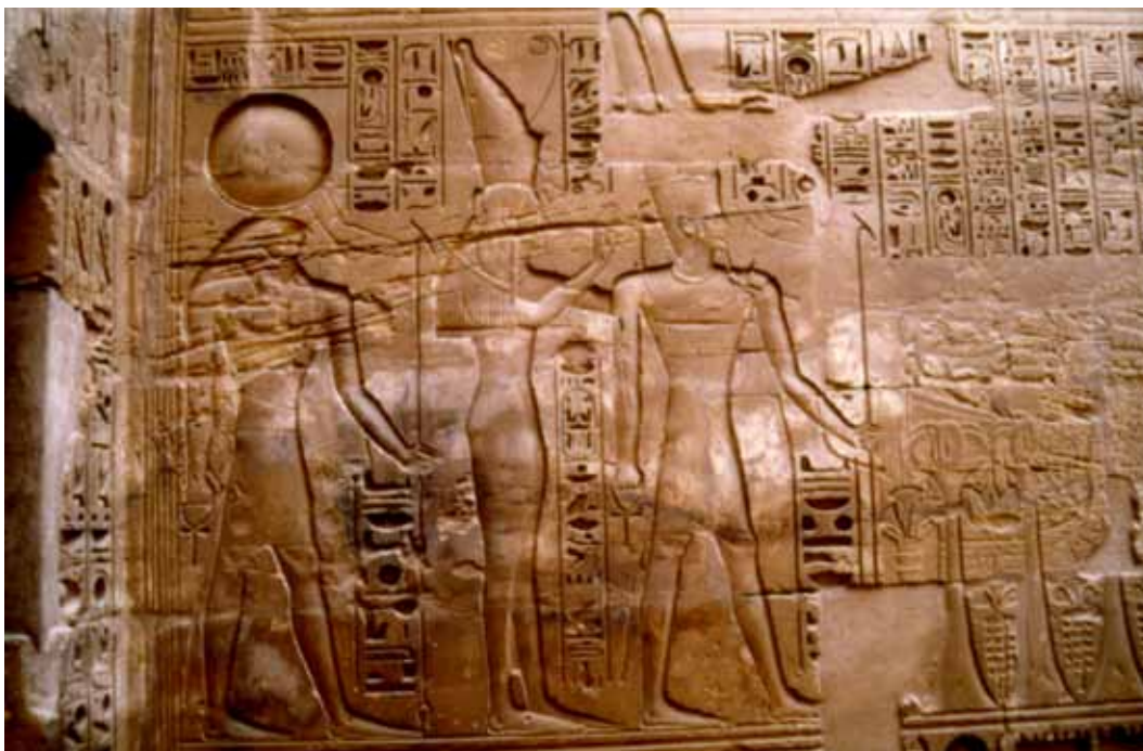
Amon (th.), Mut og Khonsu (tv.). Relief i Khonsu-templet i Karnak.