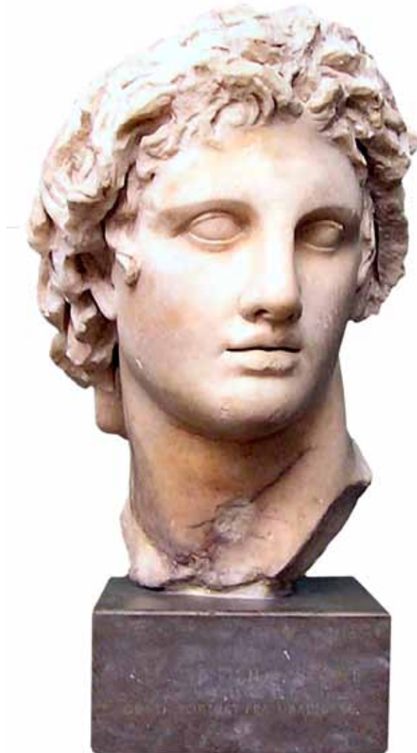
Alexander den Store