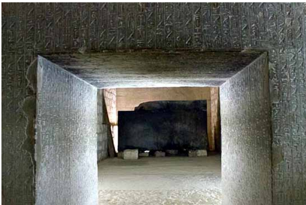
Teti-pyramidens sarkofagrum med pyramidetekster