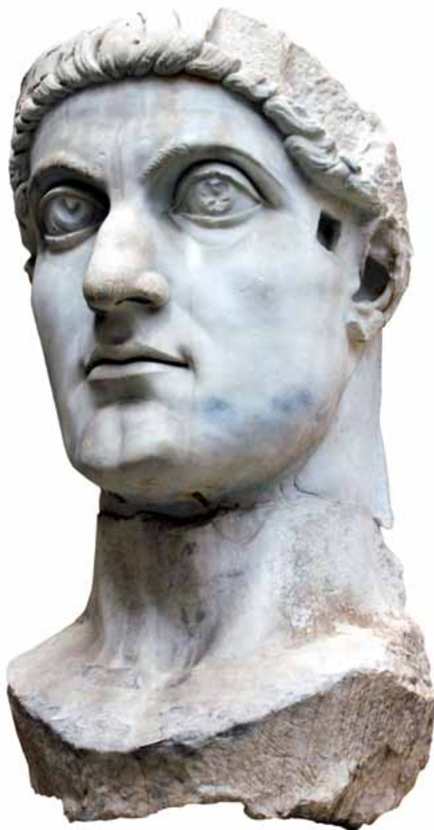
Constantin den Store