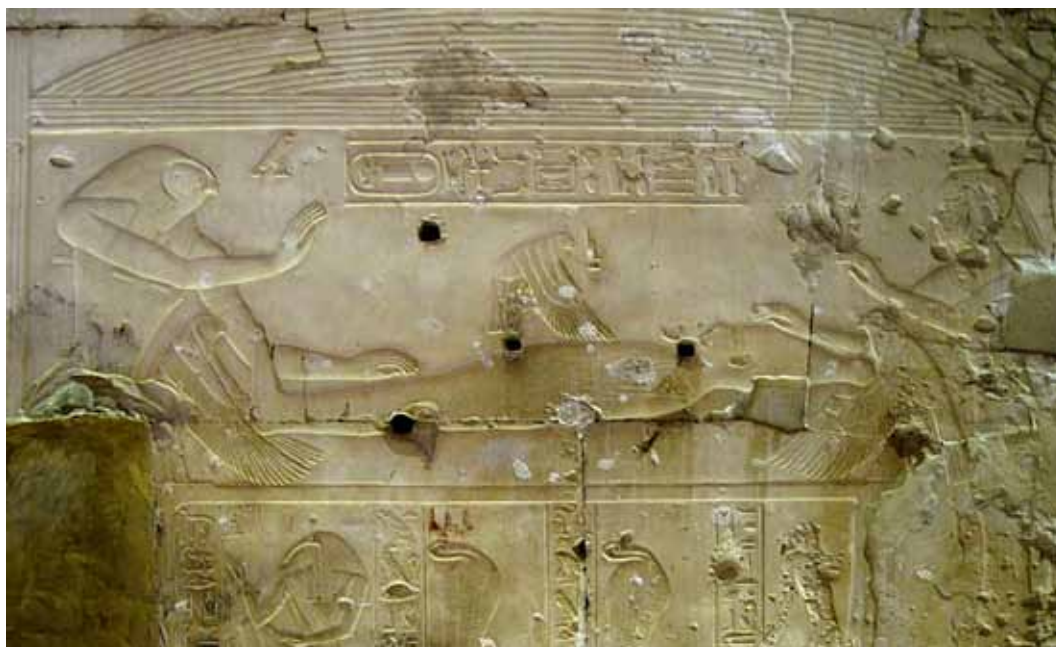
Isis forvandlede sig til en falk, sænkede sig ned over Osiris' penis og blev befrugtet af den døde Osiris. Relief i Osiris-templet i Abydos.

Da Isis fandt den druknede Osiris i kisten, omfavnede hun ham og bragte ham derved et øjeblik til live igen. Hun lagde sig ovenpå ham og undfangede Horus, som hun fødte skjult i papyrusumpen af frygt for Seth.