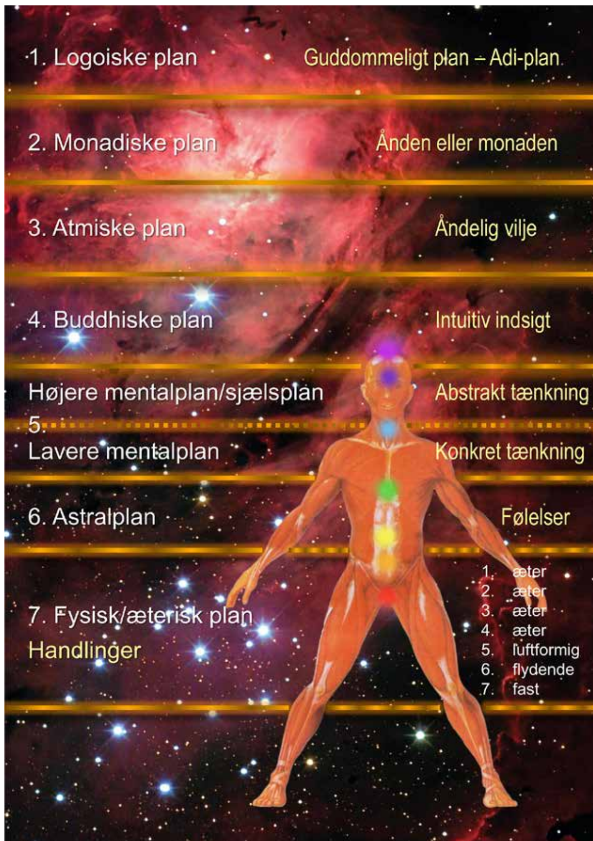
Menneskets opbygning med det fysiske, æteriske, astrale, mentale og kausale legeme og højere bevidsthedsplaner.