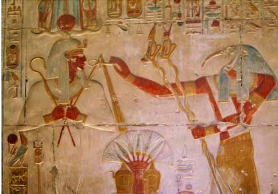
Hermes er identisk med visdomsguden Tehuti (græsk: Thoth). I relieffet fra Osiris-templet i Abydos rækker Tehuti ankh-korset – symbolet på liv – til farao Sethos I i skikkelse af Osiris.