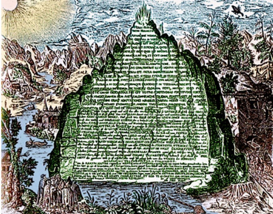
De smaragdgrønne tavler

Både Bibelen og kabbalaen har dybe rødder i den hermetiske videnskab. Hermetikken stammer fra den egyptiske visdomsgud Tehuti, som grækerne først kaldte Thoth. Senere fik han det græske navn Hermes, mens romerne kaldte ham Merkur, men de forskellige navne dækker over den samme egyptiske visdomsgud.