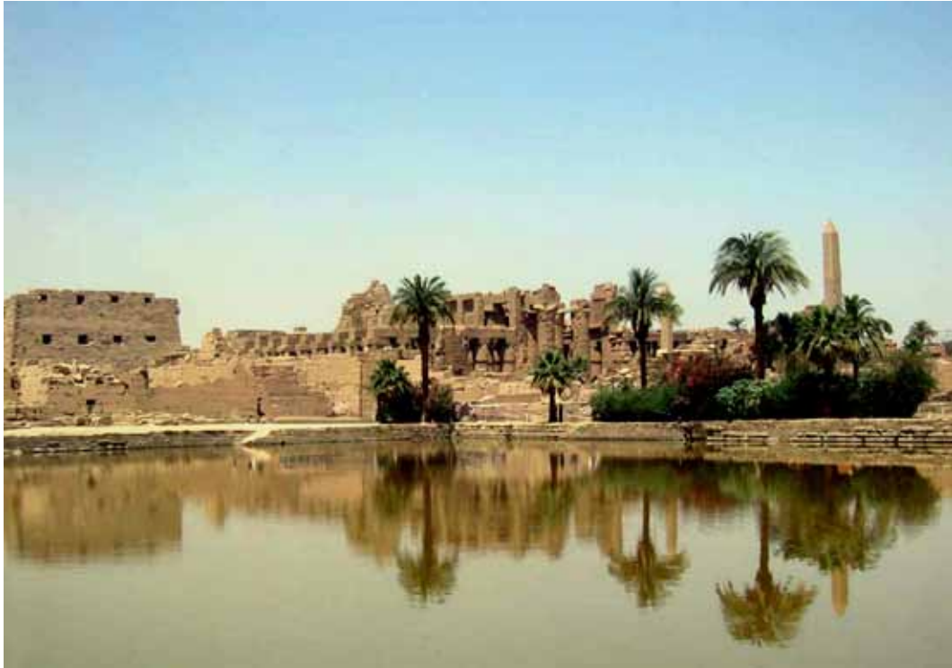
Den hellige sø i Karnak-templet er 10 meter dybt

Arbejdet kan sammenlignes med en arbejdspræstation udført med håndkraft i nutiden, for det kan sammenlignes med de kinesiske inddæmningsarbejder ved Ming-dalen, hvor 400.000 kinesere 3 med håndkraft og ved hjælp af kurve, der blev båret på ryggen, flyttede 2.000.000 kubikmeter materiale på 160 dage. Hvis bassinet ved Theben skulle være bare 3 m dybt, måtte der fjernes ca. 2.000.000 kubikmeter jord. Hvis det skal ske på 15 dage, kræves der 4.000.000 mennesker. Så mange mennesker ville selv en farao umuligt kunne samle bare for at få et bassin gravet på 15 dage.