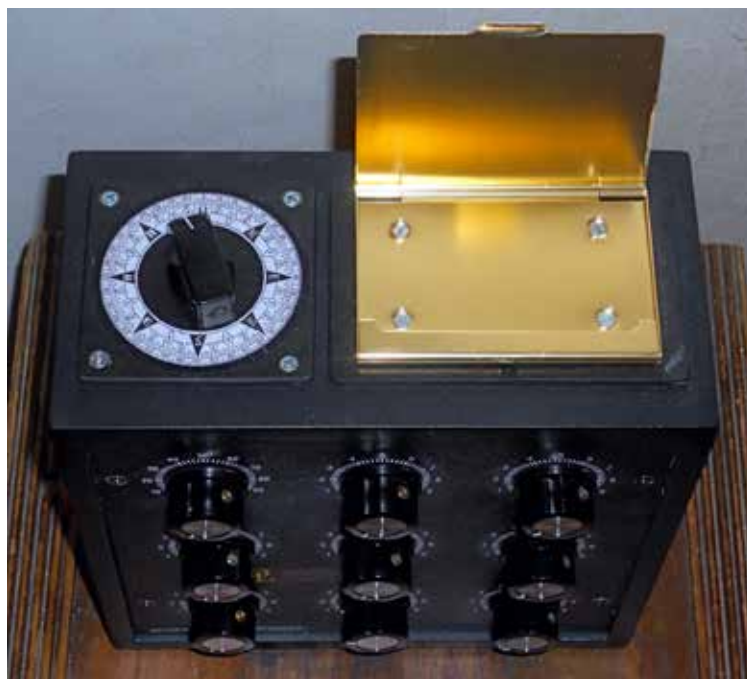
Apparat, der benyttes i forbindelse med radioni

Men brugen af de forskellige mekaniske hjælpemidler kræver en særlig form for terapeut, og derfor opnår nogle terapeuter bedre resultater end andre. Nogle mennesker kan overhovedet ikke få apparaterne til at virke. Patienten skal sende en dråbe blod, spyt, hår eller et brev, som har til formål at forbinde patienten med terapeuten via det apparat, der bruges. Terapeuten, der skal have bevidste eller ubevidste metafysiske evner (det sidste er mere almindeligt end mange tror), psykometriserer nu den æteriske udstråling fra prøven. Den subjektive psykometri er i stand til at skabe tilstrækkelig kraftige, ubevidste muskelbevægelser til at skabe svingninger i et pendul, eller ændre den æteriske spænding i terapeuten, og derved påvirkes indikatoren i apparatet. Det er terapeuten's ubevidste, metafysiske opfattelse, der gør teknikken mulig, for terapeuten registrerer prøvens psykiske overtoner og bruger instrumentet som et brændepunkt. Hele processen sker ubevidst på samme måde som ønskekvistens bevægelser i vandviserens hænder.