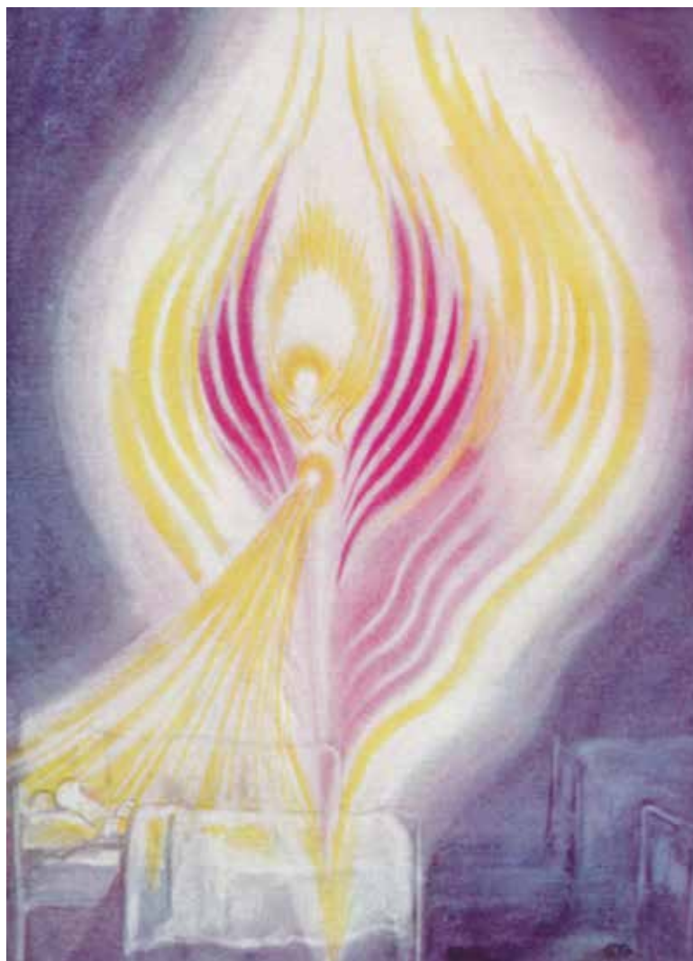
Healingsdeva (iflg. Geoffrey Hodson)

Når de usynlige skabninger opfattes af mennesket, har de næsten altid den form, som iagttageren plejer at forestille sig. Hvis man forventer, at en deva er lysende, har vinger, er klædt i lange hvide gevandter og måske har en krone på hovedet, er det netop den form devaen vil optræde i, for billederne er subjektive, de er skabt af menneskets tankesind, og de kan belives af en hvilken som helst skabning, der tilfældigvis er til stede. Neutrale iagttagelser viser medlemmerne af devariget som hurtigt roterende hvirvler af specialiseret energi, der er fokuseret omkring et intelligenscenter. Stråleglansen varierer med farvetonen og opgaven, men den er vanskelig at beskrives på grundlag af de farver, der kendes i den fysiske verden.