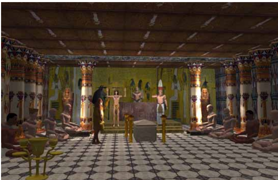
Anubis-præstens – datidens indfører – rapporterer til logens styrende mester

Åndsvidenskaben bygger ikke alene på metafysiske forskningsmetoder, men også på indlysende indicier og sund logik, og her er der ingen tvivl om, at frimurerens ritualer er en videreførelse af den oldgamle mysterielære, der blev praktiseret i det gamle Egyptens mysterieskoler. Sammenfaldet mellem de frimureriske og de egyptiske ritualer og symboler er for mange og for indlysende til, at man kan afvise dem, selvom mange forsøger det.