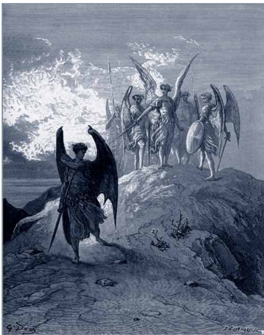
Ærkeengle og Lucifer ifølge den kristne forståelse.

I de højere verdener er der en firfoldighed, der afspejler sig i den lavere personlige firfoldighed. Den består af det fysiske legeme og det æteriske legeme, som er samlet omkring manas (tankens princip) og kama (følelsens princip). Det betyder, at mennesket, under ledelse og hjælp af " Lysbæreren ", i sin evolution både arbejder sig oppefra og nedad og nedefra og opad – et tovejsforløb hvor det ene altid afspejler det andet, uanset hvordan man ser på det, og hvor menneske-deva-forholdet bliver til en stabiliserende faktor, der er i stand til at holde menneskets kræfter i ligevægt. Det er opgaven og målet.