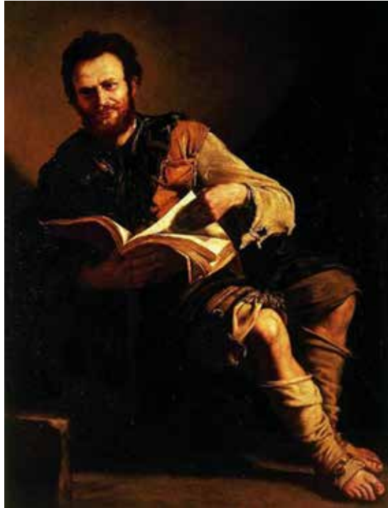
Demokrit fra Abdera