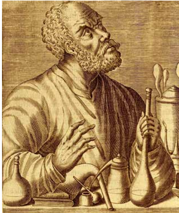
Geber - alias Abu Musa Jabir ibn Hayyan - var en fremtrædende islamisk alkymist, farmaceut, filosof, astronom og fysiker. Europæerne kalder ham "den arabiske kemis fader".