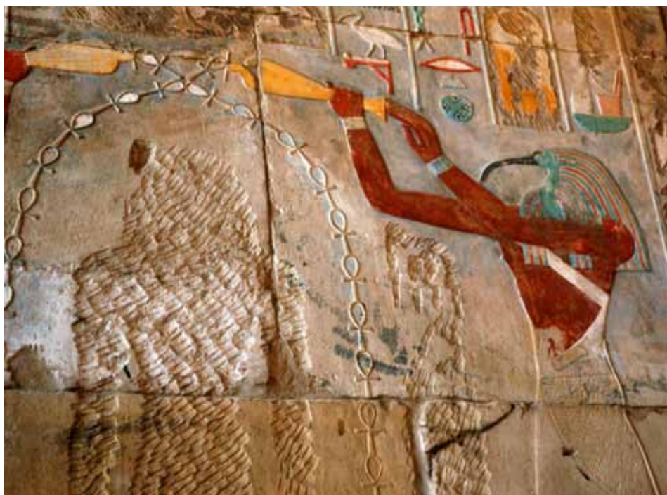
Ypperstepræst udklædt som visdomsguden Tehuti i dåbsritual

luft- og ild-prøverne på dette trin. De skulle med overbevisende sikkerhed vise, at ingen af de fire elementer på nogen måde kunne ryste dem i deres astrallegemer. Formålet var, at de skulle kunne deltage i tjenestearbejdet på astralplanet som såkaldte "usynlige hjælpere". De indviede skulle udvikle sig til øvede og kvalificerede medarbejdere både for menneskeheden i den fysiske verden og i de indre verdener. Neofytten på dette niveau kaldte man " den dobbelte Horus ". Dermed mente man det menneske, der lever med " hovedet i himlen og benene på jorden ".