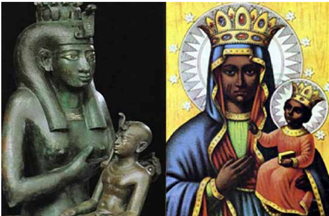
Isis og Horus-barnet – Maria og Jesus-barnet

De egyptiske ritualer afveg på nogle områder, men essensen var alligevel den samme, for det egyptiske præsteskab var i besiddelse af en tradition, som de havde arvet fra mestrene og de indviede fra Atlantis. Traditionerne blev senere lettere korrigeret for at tilpasse dem til menneskehedens bevidsthed, som på den tid udvikledes sig langsomt.