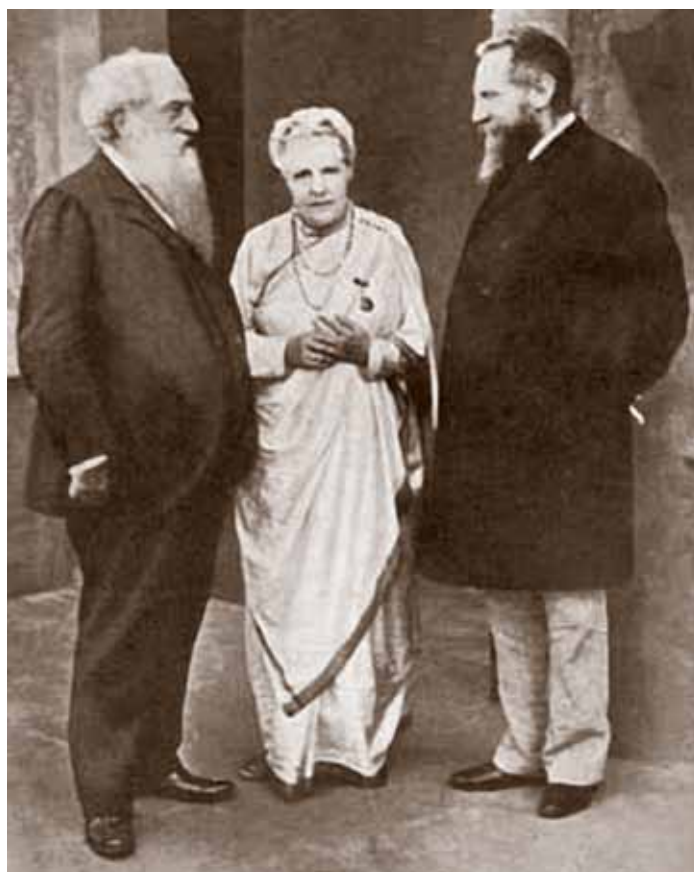
Henry Steel Olcott (tv.), Annie Besant (midt) og C.W. Leadbeater (th.)

Efter at både H.P. Blavatsky og hendes nærmeste medarbejder Henry Steel Olcott døde, blev Annie Besant præsident for Det Teosofiske Samfund .