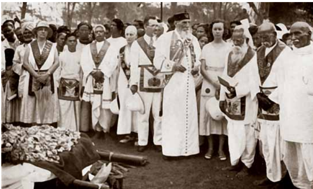
Annie Besants kremeringssceremoni, der blev udført af biskop Charles Webster Leadbeater 21. september 1933.