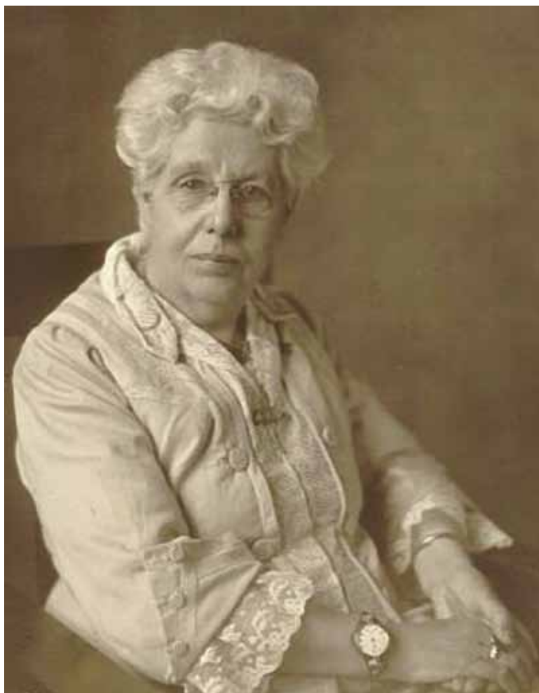
Annie Besant 1922

Selvom Annie Besant var dybt engageret i Indiens frihedsbevægelse, skrev hun en lang række teosofiske bøger og holdt utallige foredrag rundt om i verden. Hendes medarbejdere fattede ikke, hvorfra hun fik energien til alle disse aktiviteter.