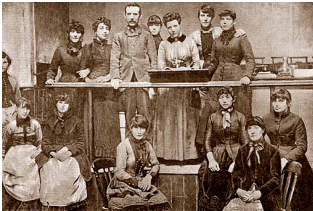
Annie Besant hos kvindelige arbejdere på tændstikfabrikkerne.

Hun interesserede sig især for områder som frihed og kvinders rettigheder, og det kom til konfrontationer med myndigheder og politi, da hun gik i spidsen for strejker mod børnearbejde i tændstikfabrikkerne, hvor mange blev syge af at arbejde med giftige fosfordampe. Hendes oratoriske begavelse viste sig for alvor, da hun talte deres sag over for myndigheder og store forsamlinger, og til sidst lykkedes det hende at ændre både arbejdsforhold og lønninger for denne befolkningsgruppe.