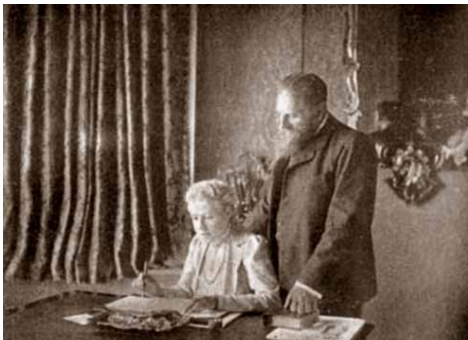
Annie Besant og C.W. Leadbeater.

Annie Besant havde efter lang tids søgen fundet, hvad hun havde ledt efter, og hun udtalte senere, at hun ønskede en gravskrift med ordlyden: "Hun forsøgte at finde sandheden" .