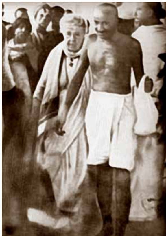
Annie Besant og Gandhi i Madras 1921

Modstanden mod Annie Besant voksede – især fra englænderne og deres indiske medløbere. Hun gjorde derfor fælles sag med Mahatma Gandhi, og hun blev på et tidspunkt valgt til præsident for National Congress – en skyggeregering, som skulle overtage ledelsen af Indien, når det engelske overherredømme blev bragt til ophør. Imidlertid var der opstået en splittelse i denne skyggeregering mellem de revolutionære og de mere moderate. Annie Besant forsøgte forgæves at forlige de to fløje, men englændernes blodbad i Amritsar og Punjab gjorde en ende på hendes politiske linje, og de revolutionære med Mahatma Gandhi i spidsen tog over. Gandhi indledte en kampagne med civil ulydighed, hvor hundredetusinder forlod regeringskontorerne og hele Indiens administration – med det resultat at titusinder døde af sult, for ingen fik udbetalt lønninger. Gandhis fejlslagne politik kom til at koste dyrt og løsslupne lovløse kræfter førte til 92 oprør mellem januar 1921 februar 1922.