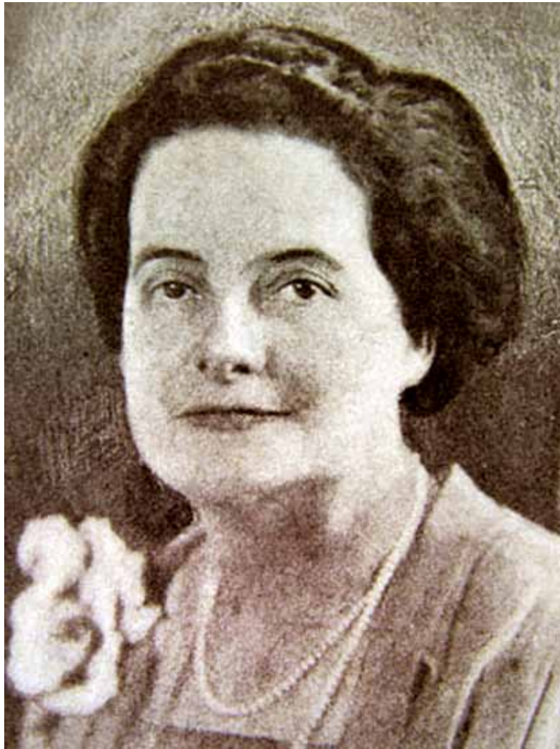
Alice A. Bailey