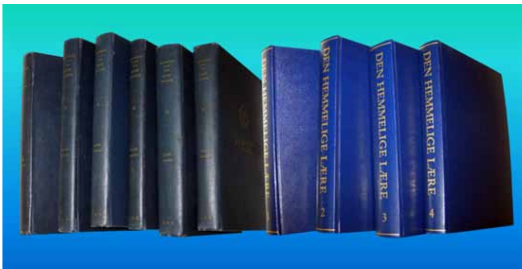
The Secret Doctrine - Den Hemmelige Lære